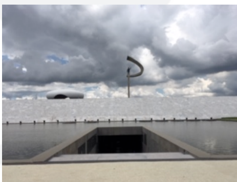
Figura 1. Oscar Niemeyer. Memorial JK. Brasília/DF.

Trauma, conflito, embate e guerra suscitam implante público de formas capazes de, por um lado, homenagear, de outro, desafiar, garantir fama e duração de dada crítica, que se deseja preservar ou desnudar. Encontram-se em espaços que constituem umbral denso entre passado doloroso, presente diverso e aspirações futuras. Agenciam-se, além destes fatores regidos por Cronos, outros, como identidade, heroísmo, raridade, espírito público para cravar na história passagens, datas cívicas ou adjetiva-se com senso oposto.