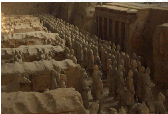
Figura 12. Parte escavada de “Guerraieros” em terracota. Xian/China.

protegido em vida, então, tal exército garantiria a após a morte. A distância destes à tumba lança outras teorias, alertadas no lugar. Curiosa é a diferença entre feições, traje, adereços e altura, esta talvez pela hierarquia militar.