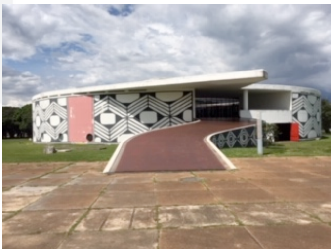
Figura 6. Oscar Niemeyer. Memorial dos Povos Indígenas. Brasília/DF.

Em que pesem variadas diligências, esteve fechado até 1999 13 ; mas, pela ação de etnias, apoiadores e profissionais, de tempos em tempos captam-se novos influxos sob a égide de repaginá-lo para expor a coleção. Entre as ações, em 2015, índios Yawalapiti realizaram durante um mês pintura do grafismo original do Xingu na parede externa do memorial. A idéia então difundida seria de rodízio entre os grupos, mas ainda se mantêm até a data de visita (2019).