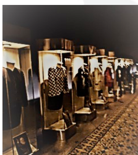
Figura 5. Memorial JK. Interior com vestuário. Brasília/DF. 19.4.2019