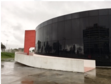
Figura 2. Arq. Oscar Niemeyer. Memorial Luís Carlos Prestes. Porto Alegre/RS.

aguarda aval: “Caminho da Soberania”, dedicado a João Goulart, Getúlio Vargas e Leonel Brisola, indicando conflitos ainda polarizados.