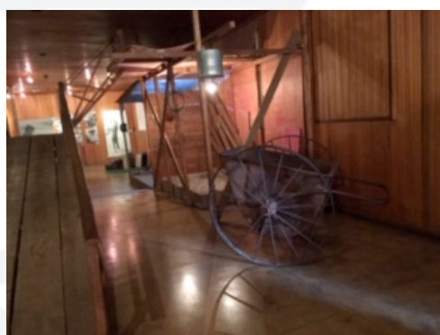
Figura 9. Museu Vivo da Memória Candanga, Núcleo Bandeirantes. Brasília/DF.