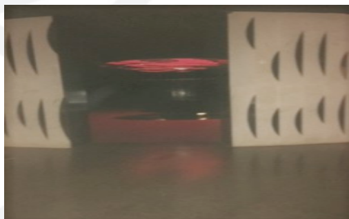
Figura 4. Arq. Oscar Niemeyer. Memorial JK. Brasília/DF. Painel de Athos Bulcão e vitral de Marianne Peretti.

Sob o comando de João Babbista Figueiredo, efetiva-se abertura do Memorial JK, com a presença de Figueiredo, em 1981, na data de nascimento do homenageado (12.9). Nesse cenário funesto, Niemeyer cria paredes curvas, como se o visitante entrasse no túnel de outro tempo luminoso, circundado por espelho d’água e rampa de acesso. Depara-se com formas brilhantes, em displays iluminados, predomínio prateado e reservando dourado para objetos-reíquias; de outro, o conjunto marca o início da tal distenção política.