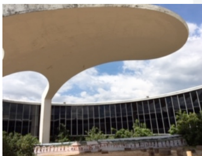
Figura 7. Arq. Oscar Niemeyer. Interior do MIP. Brasília/DF.

Larga rampa conduz público do térreo ao andar principal. Sutilezas foram propostas, desde o ingresso do visitante: enquanto neste sai-se da intensa luz da rua para certa penumbra, em outros, como o de JK e o de Prestes, a clive leva à entrada e acentua desenho magno adotado no edifício, a espiral. Neste caso, Niemeyer preferiu a forma de maloca dos índios Yanomami.