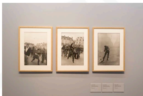
Figuras 4 a 7 - Exposição Levantes, no SESC Pinheiros, São Paulo. Imagens da abertura da Exposição Levantes, realizada em 18/10/2017. Centro de Produção Audiovisual – CPA.