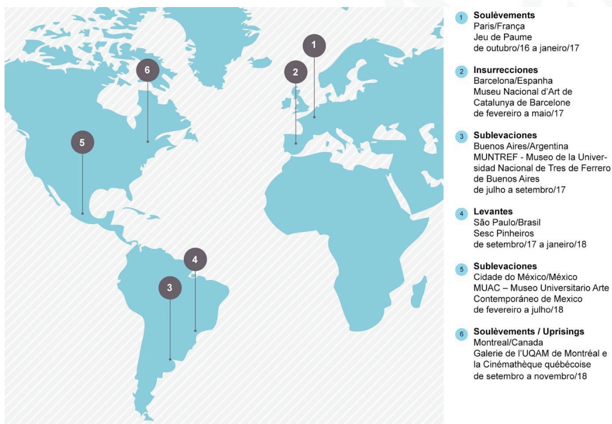
Figura 3 - Mapa da itinerância da exposição.

Podemos identificar a exposição Soulèvements como um projeto estético. Como parte do corpo da exposição, conferências foram proferidas pelo curador em cada local de montagem; houve, ainda, um denso catálogo com seus textos, adicionado de escritos de filósofos e pensadores da atualidade, além de imagens da exposição. A relação da exposição com as pesquisas teóricas do curador é explicitada no ensaio Através dos desejos (fragmentos sobre o que nos subleva), presente no catálogo da exposição. O mote da exposição, de tonalidade vincadamente política, não poderia ser mais pertinente para o debate contemporâneo, na dita era das imagens ou, segundo Ludueña Romandini (2017), a era do Atlas.