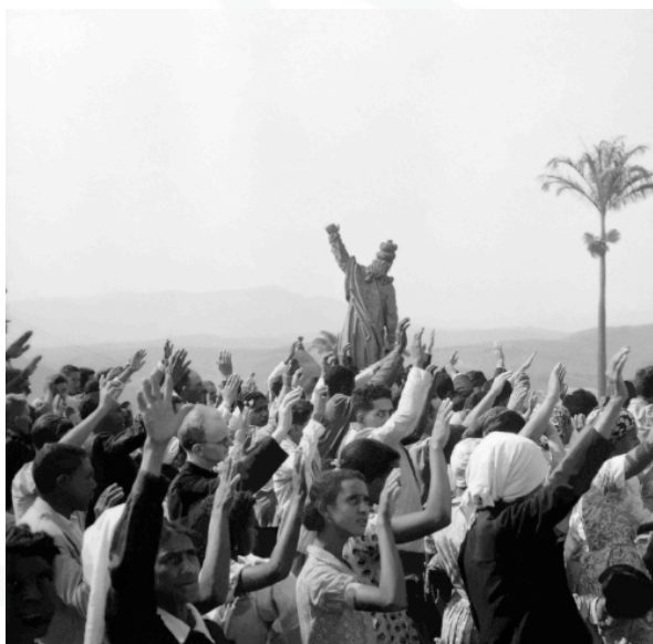
Figura 8 - Marcel Gautherot, Profeta Habacuque no Santuário diocesano de Bom Jesus de Matosinhos, c. 1947.