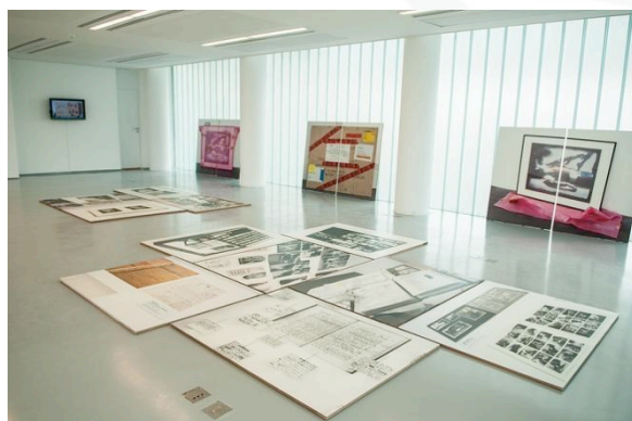
Figura 1 e 2 - Exposição Atlas, Suíte. Museu de Arte do Rio, Rio de Janeiro (2013). Curadoria de Georges Didi-Huberman e Arno Gisinger.