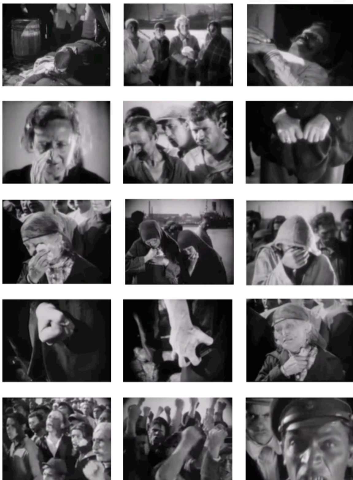
Figura 10 - Serguei Eisenstein, Encouraçado Potemkin , 1929. Frames do filme.