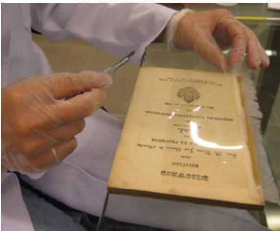
Figura 1. Os danos mais comuns são os rasgos dos documentos e as perdas de partes dos suportes originais, as perdas de partes de encadernações, sendo as mais comuns a perda da lombada ou de partes dela e também de capas das obras. Fonte: Laboratório de Conservação Preventiva da BBM-USP.

Figura 2. Livro em processo de higienização. Fonte: Laboratório de Conservação Preventiva da BBM-USP.