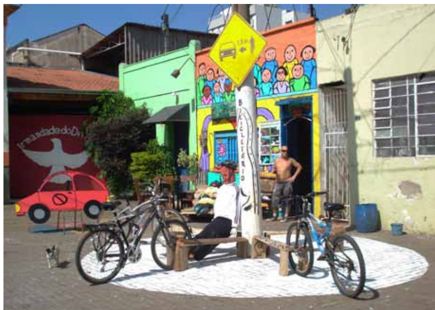
Figura 2: Local da intervenção: Rua do Porto em Piracicaba/SP.

Foi utilizado também um “carro” de madeira com as inscrições “Menos Carro, Mais Bicicleta”, um jargão do cicloativismo brasileiro (Figuras 2 e 3).