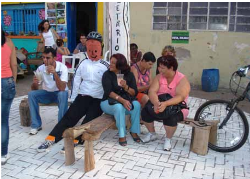
Figura 3: População de Piracicaba, interagindo com a intervenção no Largo dos Pescadores, em Piracicaba/SP.

Foram aplicadas, no local, 50 entrevistas, que serviram de base para a realização da análise de conteúdo.