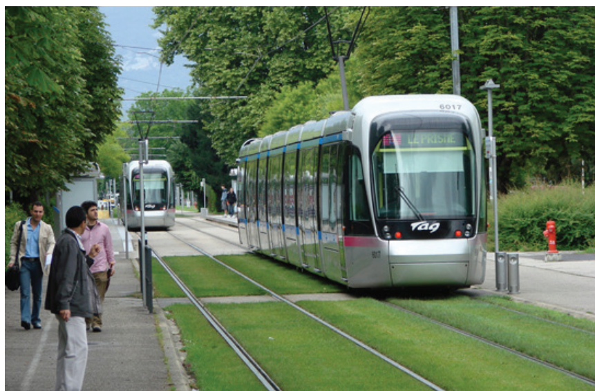
Figura 4 – VLT Grenoble - França