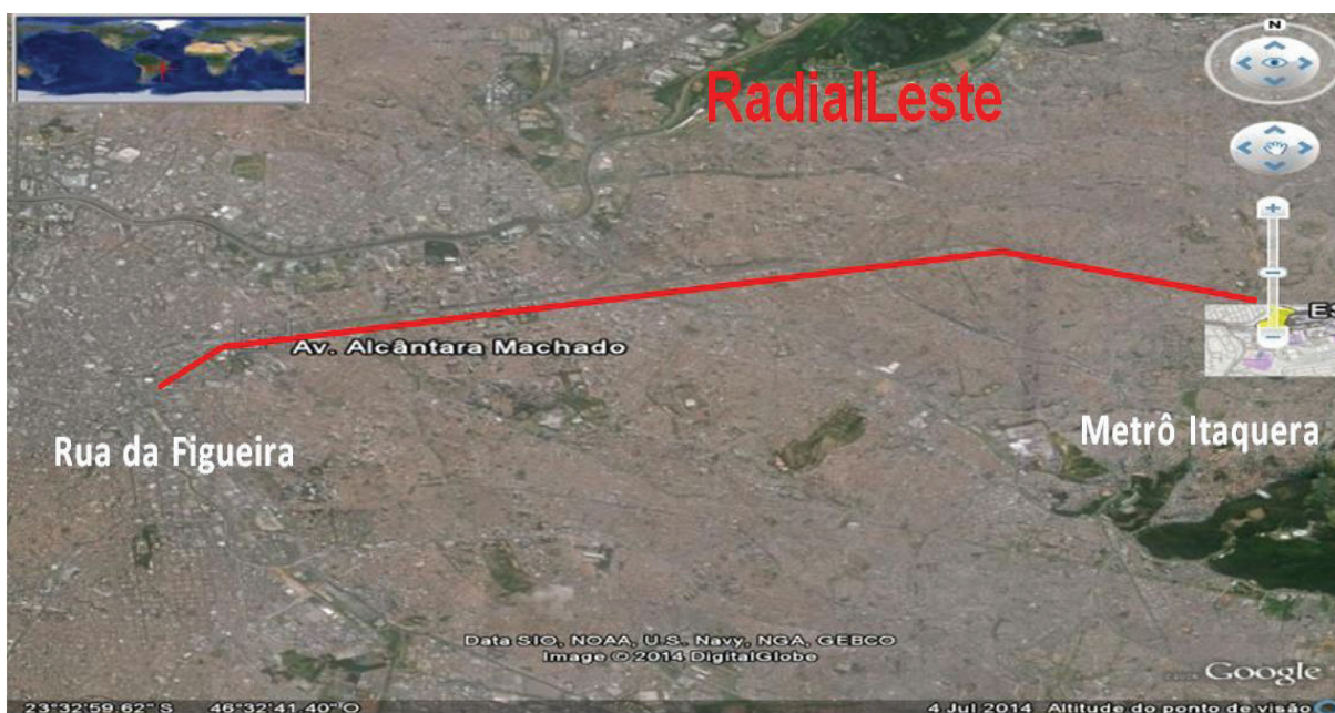
Figura 1 – Foto Google Earth 04/07/2014 – intervenção do autor trecho: Radial Leste