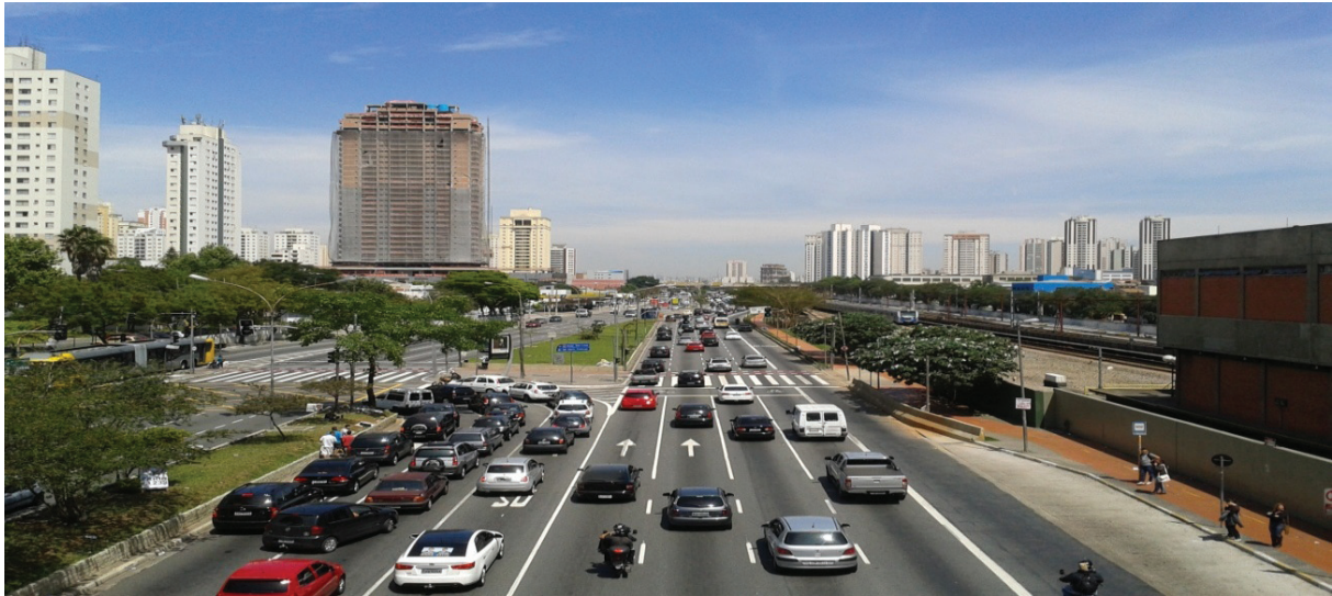
Figura 2 – Foto Autor – Radial Leste – vista da Passarela Metrô Carrão – 26/09/2014

Na figura 2 está demonstrado que o espaço da calha viária (inclui passeios) pode ser utilizado por pedestres, ciclistas, automóveis/motocicletas/caminhões e ônibus (faixa exclusiva à direita), pode-se observar também o espaço paralelo à avenida ocupado pelo transporte sobre trilhos (trem e metrô).