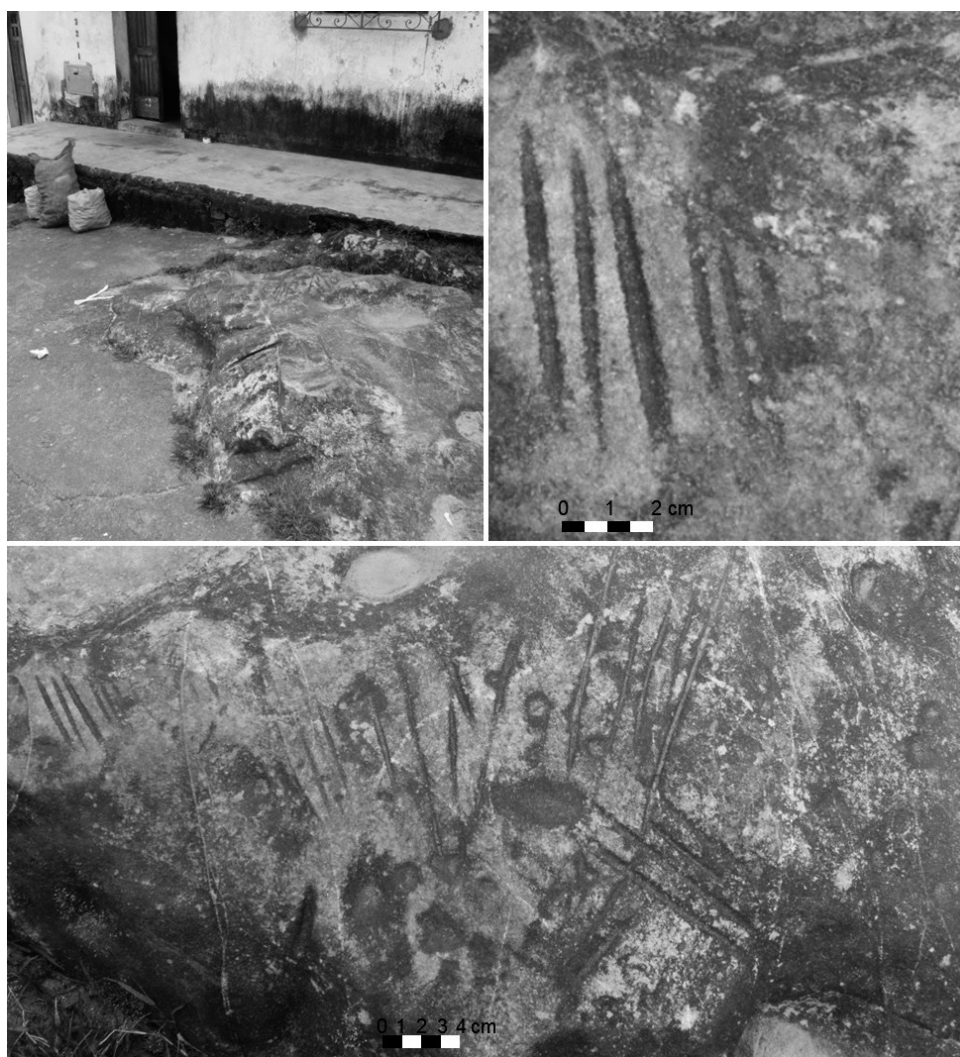
Fig. 1. Vista do sítio Angolá (à esquerda, acima); em detalhe amoladores-polidores.

O sítio Pedra do Índio está localizado a aproximadamente 8 km da atual linha de costa, às margens de um riacho que integra a porção