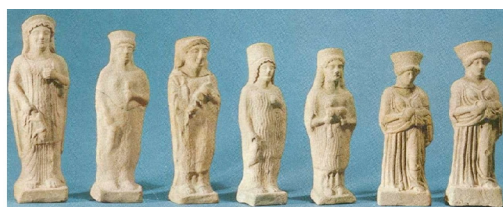
Image 2b. Gela. Statuettes de Demeter-Coré avec des petits cochons dans les bras (Griffo, Matt, 1964: 136).