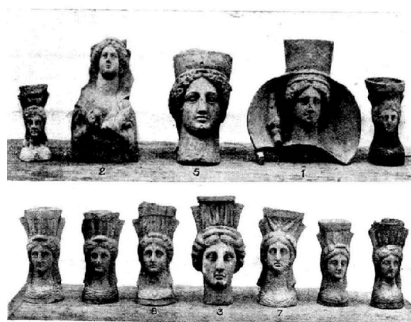
Image 3a. Cartago. Figurinhas de Deméter e queima-perfumes votivos provenientes da necrópole dos Rabs (sacerdotes e sacerdotisas de Cartago), nas vizinhanças da colina de Sainte-Monique (Dellatre 1923: 358).