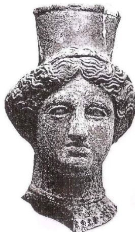
Image 2a. Agrigente (Musée Archéologique National de Syracuse). Buste de femme (Hirata, 1986: planche 22,2).

trouvé en 1923 d'une figurine avec un signal de Tanit a enflammé le débat sur la possibilité d'assimilation entre les divinités grecque et punique, ou tout au moins il y avait une certaine assimilation du type coroplastique parmi certains groupes puniques. Ce thème sera mieux discuté plus tard.