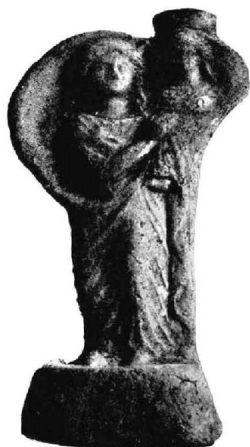
Image 3b. Statuette de Demeter et Coré dans le bras, avec peplos (Delattre, 1903: 434, fig. 3).

Il y doit considérer que l'emplacement de la découverte est dans le haut de la pente (vers la mer) de la colline de Sainte Monique, près de la nécropole des Rabs (voir Carte 1), nécropole qui a été utilisée à partir du Ve à la moitié du IIe siècle av. J.-C., ce qui signifie que le dépôt votif était hors de l'aire de la cité et autour de la zone de la nécropole.