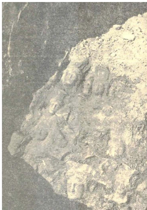
Image 1. Carthage vue de la favissa du Sanctuaire de Demeter et Coré (Delattre, 1923:6)

Au cours des fouilles de 1923 par A. L. Delattre sur la colline de Bordj Djedid à Carthage ( Carte 1 ), il a trouvé un sanctuaire attribué à Déméter et Coré, « cette identification fait suite à la favissa (Image 1) qu'il émerge avec des figurines de Déméter et Coré et des brûle-parfums sur la tête de l'une des Deux Déesses » (Lipiński 1995: 375-376), appelé thymateria (voir Image 2A et 2B pour les thymateria grecs de Sicile, de Gela et d'Agrigente ; Image 3A et 3B pour celles trouvées à Carthage) ; le fait que ces figurines aient été trouvées dans une favissa caractérise la nature du culte réalisé dans ce sanctuaire. A. Krandel-Ben Younès souvient que ce matériel aurait pu être utilisé par les