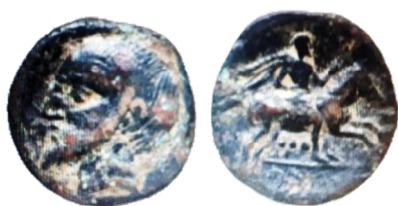
Fig. 18a. Monnaies de Syphax

A partir du règne de Juba Ier, des figures divines apparaissent sur les émissions royales (Bridoux 2011 : 36 ; Mazard 1955: 50-52). Elles remplacent parfois le portrait du souverain au droit des monnaies de bronze ou de billon. En effet, les monnaies de ce roi témoignent d'une importante évolution, tant sur le plan des métaux utilisés que sur celui des légendes ou de l'iconographie. En période de crise, le monnayage recherchait en général la réaffirmation de l'autorité royale (Alexandropoulos 2000 : 173-186 ; Alexandropoulos 2012 : 211-234 ; Bridoux 2011 : 36).