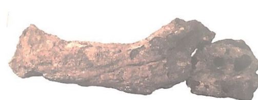
Fig. 11. Côte de mailles du mobilier d'El Khroub

anciennes : la chronologie des événements, l'évolution de l'architecture, les pratiques funéraires et l'aspect civilisationnel. Soit, tout ce que l'on peut comprendre par l'étude des produits régionaux ou étrangers déposés dans une tombe (Krandel- Ben Younes 2002).