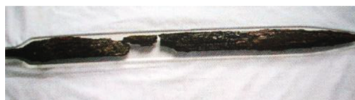
Fig. 19. L'épée

(Krandel-Ben Younes 2002 : 2). Ils souhaitaient, à travers cette symbolique, montrer leur vaillance ou leur réussite dans la carrière militaire (Bertrand & Szyner 1987: 73).