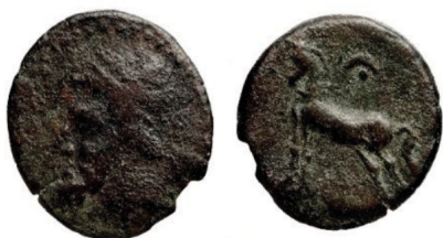
Fig. 21. Monnaie du roi Massinissa ou Micipsa