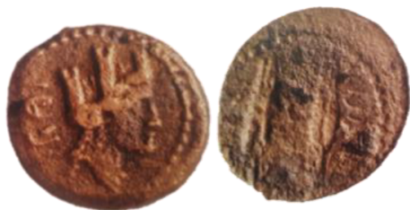
Fig. 16. Monnaie de Cirta, type « épi de blé »

On ne peut que porter au crédit de Massinissa l'organisation de la production agricole et le développement d'une politique économique numide avec ses voisins méditerranéens (Lassère 2015 : 58). Ses successeurs ont prolongé son action.