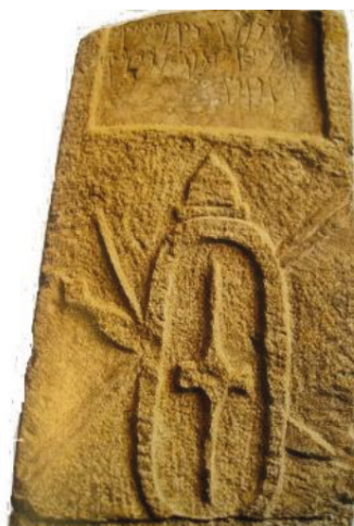
Fig. 4. Du Sanctuaire punique d'el-Hofra (fouillé en 1950).

D'autres armes, offensives, celles-ci, ornent également les stèles de Cirta, notamment l'épée et le javelot.