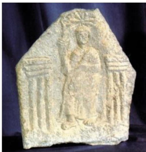
Fig. 2. Stèle d'El Hofra

représentée seule, figure sur huit stèles. Elle accompagne souvent le signe de Tanit (Berthier & Chartier 1955: 214; Krandel-Ben Younes 2002 : 242-250 ; Le Glay 1966: 153). La représentation graphique astrale (Fig. 3) sous la forme symbolique d'un disque (soleil) ou d'un croissant (lune) est fréquente sur les stèles d'El Hofra. Le croissant, observable sur 87 stèles, figure rarement seul sur le fronton, et très souvent il enserre le disque ; il en est de même pour le disque qui n'est représenté seul que sur deux stèles. Le croissant et le disque, souvent sculptés en méplat, sont soit unis l'un à l'autre, tangent ou encore séparés. Quant au dessin de l'étoile, on l'aperçoit au fronton de quelques stèles seulement (Krandel-Ben Younes 2002 : 248-250 ; Le Glay 1966: 153).