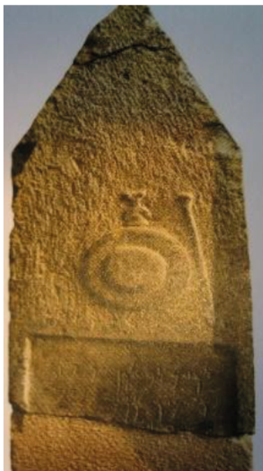
Fig. 5. Du Sanctuaire punique d'el-Hofra (fouillé en 1950)

Provenance: Sanctuaire punique d'el-Hofra (fouillé en 1950).