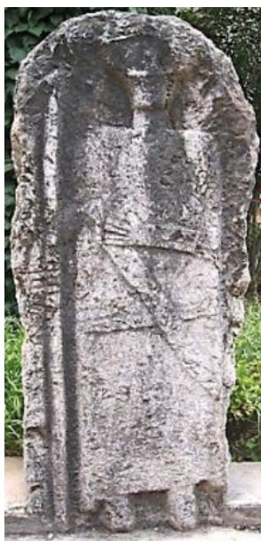
Fig. 8. Stèle d'Aïn Mlila

Provenance: Tirakbine, village Bouchène, Aïn Mlila.