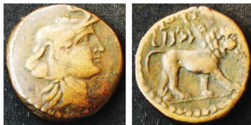
Fig. 22. Monnaie de Juba Ier

Source: Alexandropoulos 2000: 398; Catalogue du Musée de Cirta 2015; Février 1984: 79-80; Mazard 1955: 42.