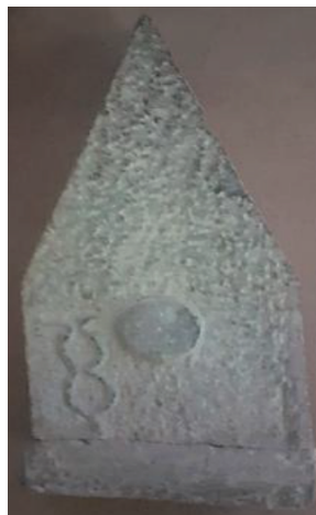
Fig. 6. Stèle d'El-Hofra

Provenance: Sanctuaire d'El-Hofra (fouille 1950).