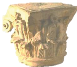
Fig. 13. Chapiteau corinthien