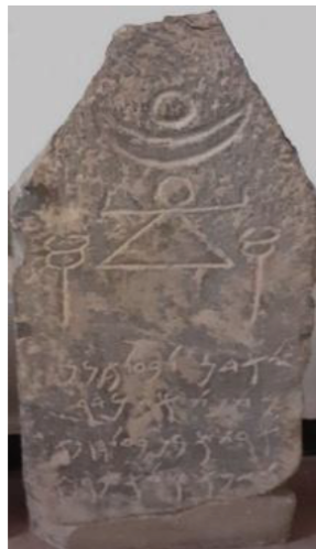
Fig. 3. Stèle votive