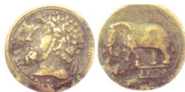
Fig. 17. Monnaie de Cirta, type « l'éléphant »