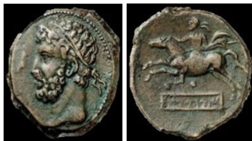
Fig.18b. Monnaies de Syphax