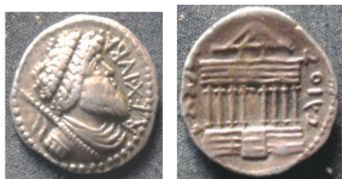
Fig. 15. Monnaie de Juba Ier

quatre et laissant libre, au centre, une entrée. Dans le style des temples romains, ces colonnes, dont les bases sont moulurées, reposent sur un podium. Au sommet de la porte, un linteau supporte un édicule, de dimension plus réduite, lui-même surmonté d'un toit à double pente donnant de face un fronton. Ce dernier se distingue bien des frontons gréco-romains qui montrent plutôt un lanterneau surélevé qu'un fronton triangulaire (Bertrand 1989: 331).