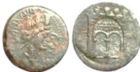
Fig. 12. Monnaie de la ville de Cirta

est daté du IIe ou du Ier siècle (Berthier 1981: 169-160; Kitouni-Daho 2003: 43; Kitouni-Daho 2015: 220).