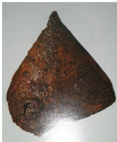
Fig. 9. Casque du mobilier de la Soumâa d'El-Khroub