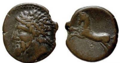
Fig. 20. Monnaie du roi Massinissa ou Micipsa

De même, les formules votives « classiques » à l'adresse de Ba'al Hammon ont été réécrites en Numidie. A Cirta, certaines dédicaces se sont limitées à la mention du nom du dédicant. C'était plutôt l'exaucement du vœu et l'accomplissement du sacrifice qui comptait le plus. Au niveau des formules votives, par exemple, il est constaté que certaines expressions utilisées semblent être propres aux Numides. Ces derniers ont su adapter les rites étrangers à leurs propres préoccupations culturelles (Krandel-Ben Younes 2002 : 441).