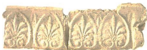
Fig. 14. Ornementation en stuc

corinthiennes à têtes pendantes et d'un décor en forme de spirale sur les quatre bords du chapiteau avec des fleurs au milieu. La partie inférieure est de forme cylindrique avec un bord renflé. La couronne est bien réalisée; sa sculpture est complexe et riche, Source: Die Numider 1979: 470, Catalogue «KRTN-Cirta». Les royaumes numides : Ve - 1er siècle av. J.C. 2015: 184-185.