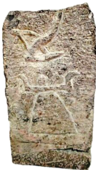
Fig. 10. Araire: Stèle d'El Hofra

main droite (Bertrand 1994: 1964-1977). Et après la mort de Micipsa, survenue en 118, on note, là encore, un déclin de la qualité iconographique des stèles (Bertrand 1989: 362).