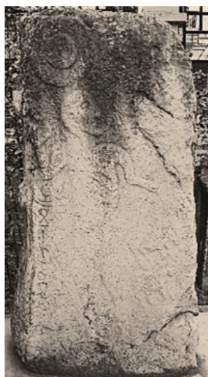
Fig. 7. Menhir libyque