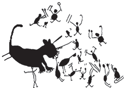
Fig. 1 – São Raimundo Nonato, PI. Martin 1999: 273.

Já adiantei algumas informações sobre o modo de vida dos primeiros caçadores que chegaram ao território brasileiro e agora passo a enfocar os que ocuparam a região Nordeste, incluindo aí o norte do estado de Minas Gerais, onde ocorrem pinturas e gravuras que representam homens, emas, cervídeos e que se caracterizam pela presença de figuras humanas formando cenas de caça, dança, guerra, sexo e rituais. Há nesses grafismos uma profusão de informações sobre a rotina dos artistas e de seu grupo. Eles carregam bastões, cestas, usam propulsores e inúmeros outros objetos (Fig. 1).