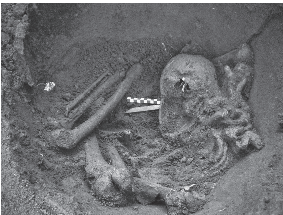
Fig. 5. Sepultamento em urna de membros do grupo.

Goitacá e Tupinambá, podem-se perceber, ao mesmo tempo, semelhanças e especificidades culturais. O fogo fúnebre, em cima ou ao lado do corpo, é uma presença constante, como também o é a associação entre o domínio