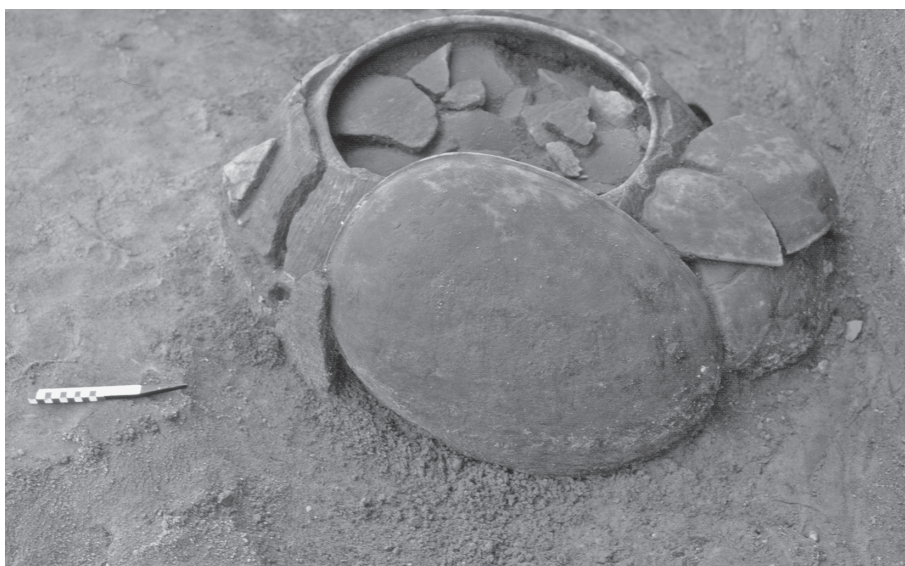
Fig. 3. Sepultamento em urna. Aldeia Morro Grande, Araruama.

O fogo é constante no ritual. As fogueiras são em geral circulares, com dimensões que variam de 0,30 a 0,50 m e espessura que pode atingir 0,20 m e estão localizadas ao lado do sepultamento. Elas ocorrem preferencialmente nos conjuntos mais complexos, com a presença de vasilhas pintadas, e fornecem indícios de que a oferenda alimentar foi expressiva; há marcas de queima na face externa e vestígios de impregnação de alimen-