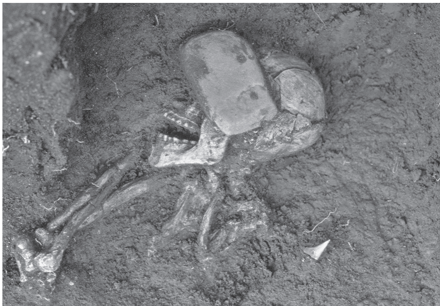
Fig. 2. Sepultamento em Sambaqui.

enterramentos. Por outro lado, adultos sem instrumentos fazem pensar em diferenciações sociais para além daquelas associadas à idade. Instrumentos apontam para a presença de indivíduos de destaque e/ou grupos de afinidade . 5