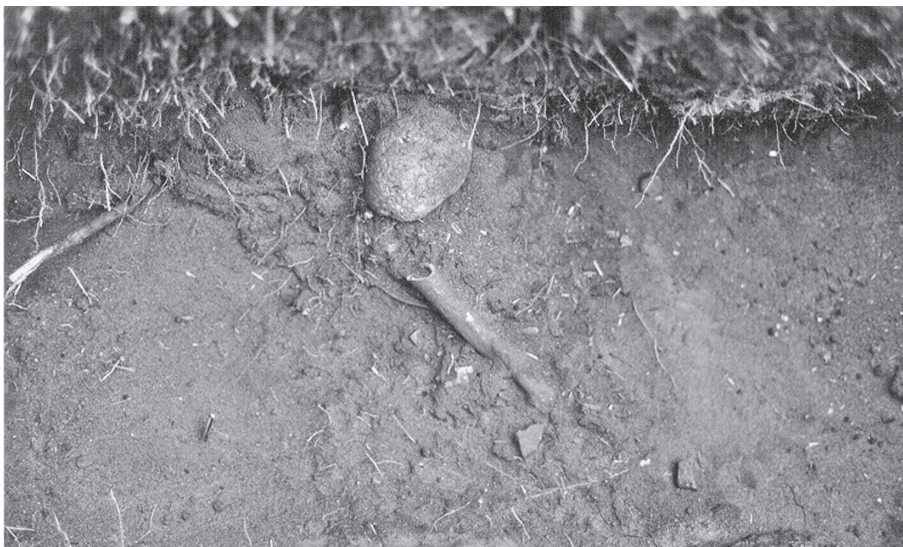
Fig. 4. Sepultamento dos “outros”. (Foto: J. Cordeiro).