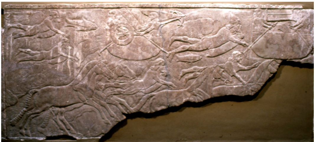
Fig. 3. Placa B-11 da sala do trono do palácio noroeste de Kalhu Fonte: © The Trustees of the British Museum (BM 124543). Registro inferior.