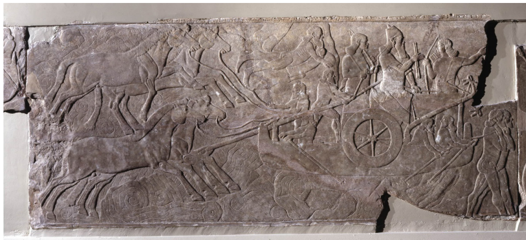
Fig. 4. Placa B-9 da sala do trono do palácio noroeste de Kalhu

(BM 124545). Registro inferior.