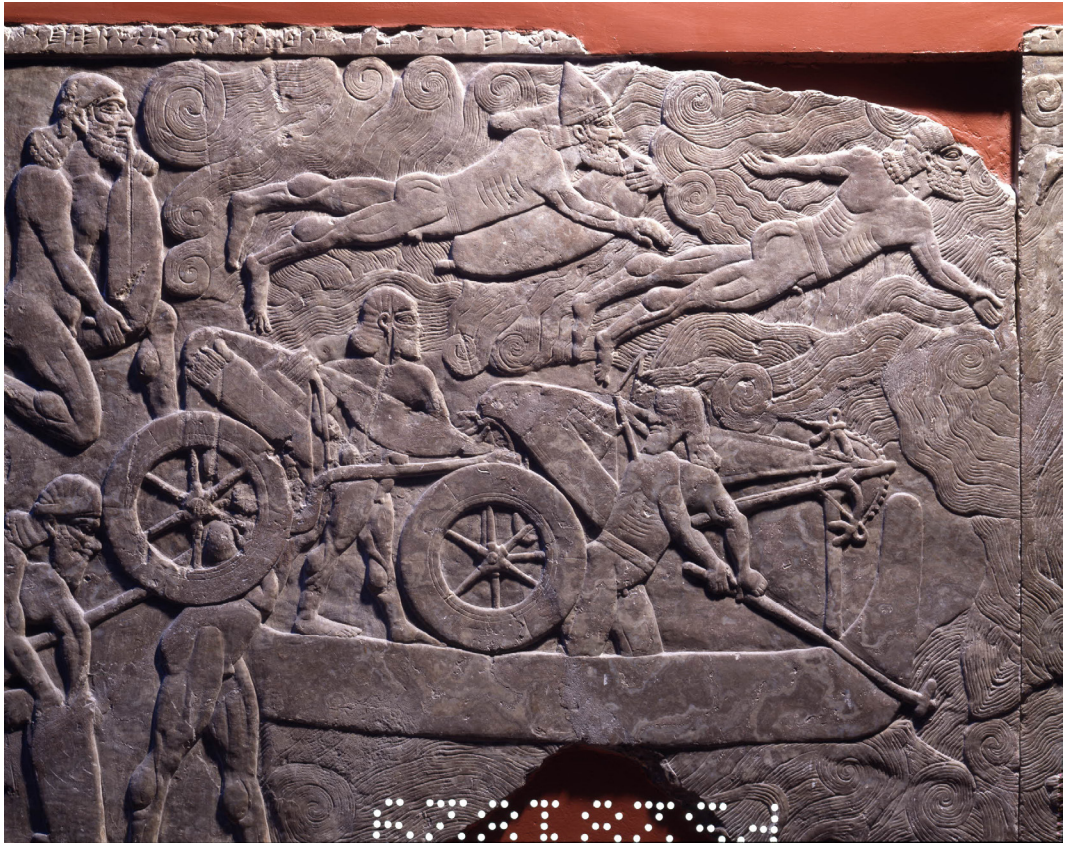
Fig. 2. Placa B-11 da sala do trono do palácio noroeste de Kalhu Fonte: © The Trustees of the British Museum (BM 124541). Registro inferior.