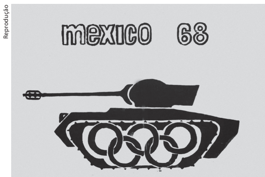
Pôster anônimo contra os Jogos Olímpicos do México 1968

Dez dias antes da abertura, milhares de estudantes mexicanos participaram de uma intensa onda de protestos contra a realização dos jogos, contra a estrutura social do país e contra a invasão de duas universidades por forças militares. Concentrados na Plaza de las Tres Culturas, os manifestantes foram atacados por soldados fortemente armados. Estima-se em 300 o número de mortos,