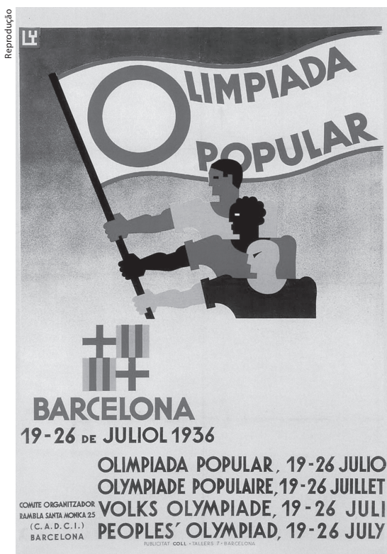
Cartaz da Olimpíada Popular de Barcelona, em 1936

Mesmo assim, milhares de atletas de 22 países inscreveram-se na competição, contando com delegações de atletas exilados da Alemanha e Itália, judeus, sindicalistas e lideranças de esquerda. Com o início da Guerra Civil, centenas de atletas ingressaram nas fileiras republicanas para combater as tropas franquistas.