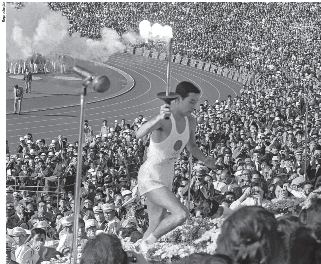
Yoshinori Sakai conduz a tocha olímpica na cerimônia de abertura dos Jogos Olímpicos de Tóquio 1964

atrocidades da Segunda Guerra Mundial no contexto da Guerra do Vietnã.