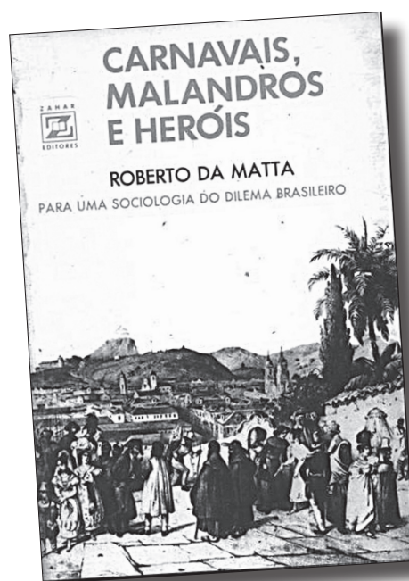
Capa da primeira edição do livro de Roberto DaMatta

leiros e realizando análises antropológicas de seus ritos sociais. Um momento marcante foi a publicação, em 1979, de Carnavais, Malandros e Heróis . Esse livro tornou-se, na época, um dos mais citados em uma significativa coleção de teses (Gomes, Barbosa & Drummond, 2000).