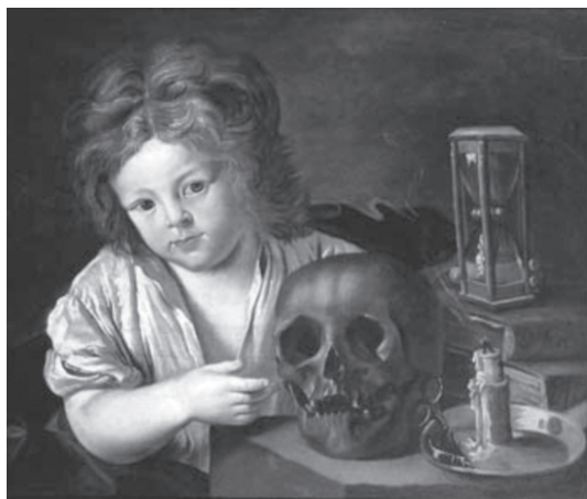
Antoine Le Nain, A Vanitas

“O tempo imaginário da ficção, condicionado pela linguagem, liga momentos que o tempo real separa, inverte a sua ordem, perturba a distinção entre eles, comprime-os, dilata-os, retarda-os e acelera-os. Deve-se essa ‘infinita docilidade’ do tempo da narrativa ficcional como obra literária à sua duplicidade, pois que ele se articula nos dois planos, nem sempre paralelos, da história e do discurso” (Nunes, 1992, p. 350).