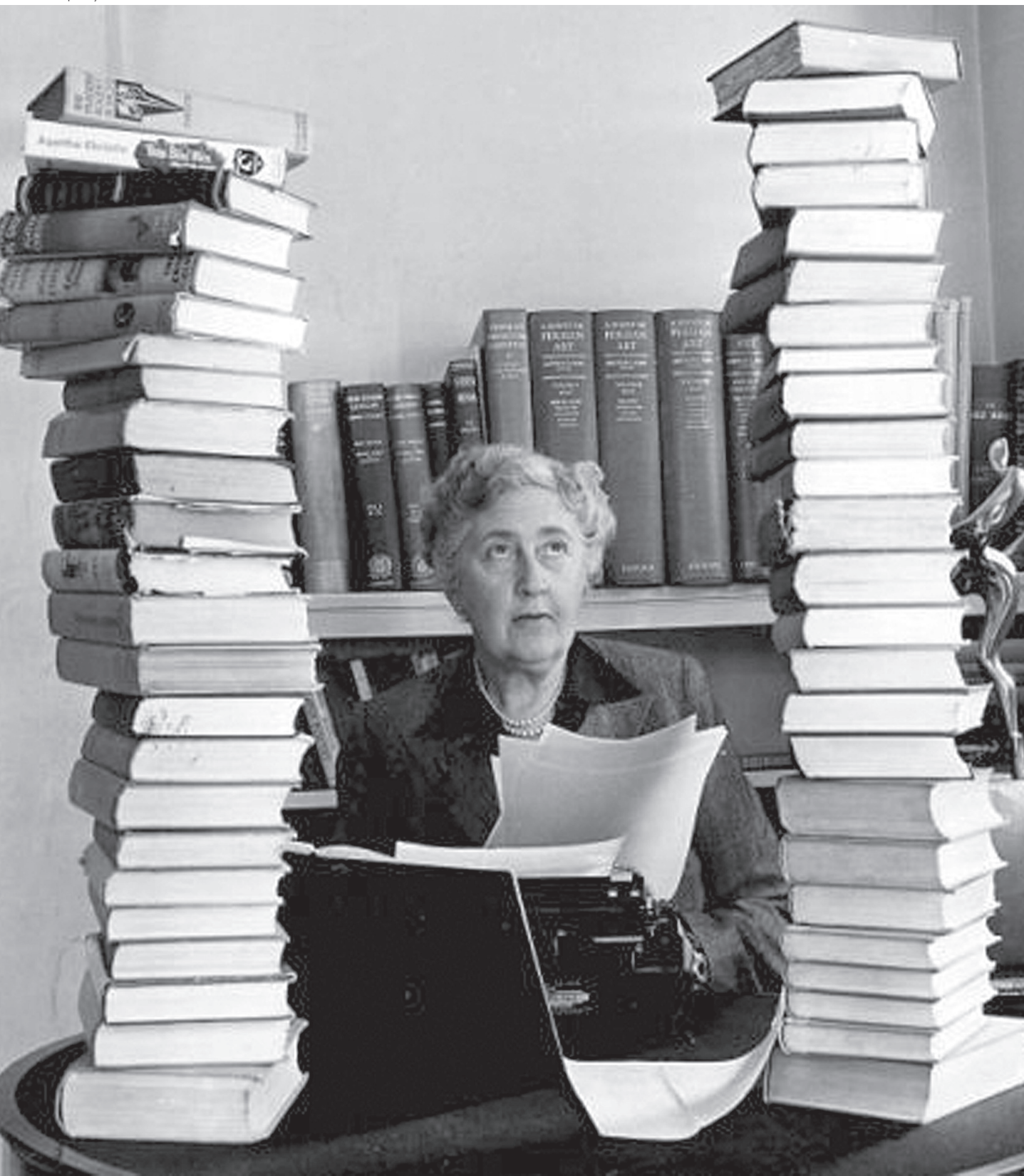
A escritora em foto de 1950