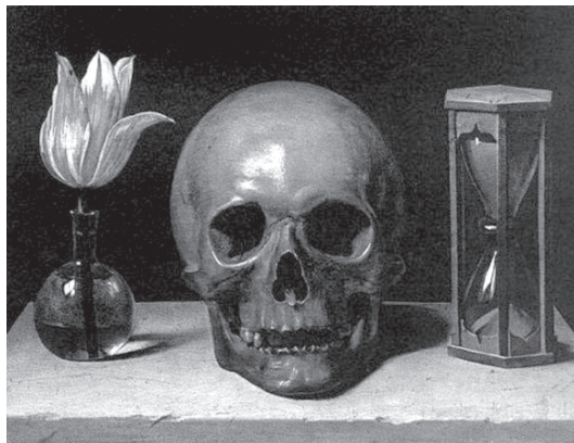
Philippe de Champaigne, Natureza Morta com Caveira