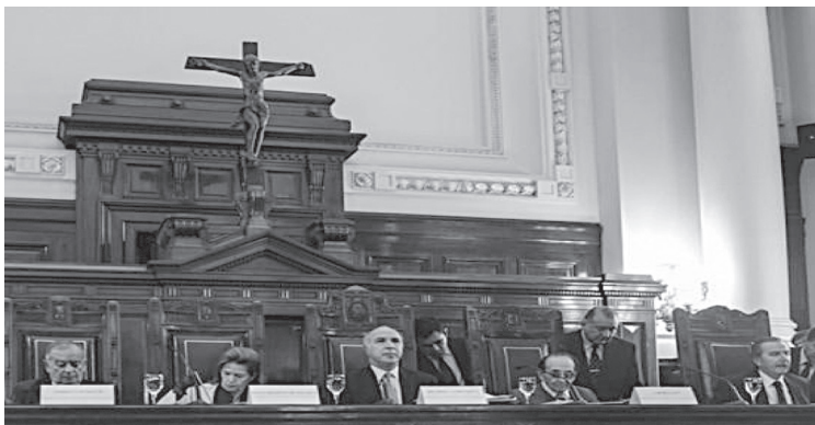
Crucifixo na Corte Suprema de Justiça da Nação