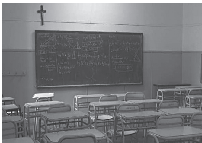
Crucifixo em uma sala de aula de uma escola de gestão estatal