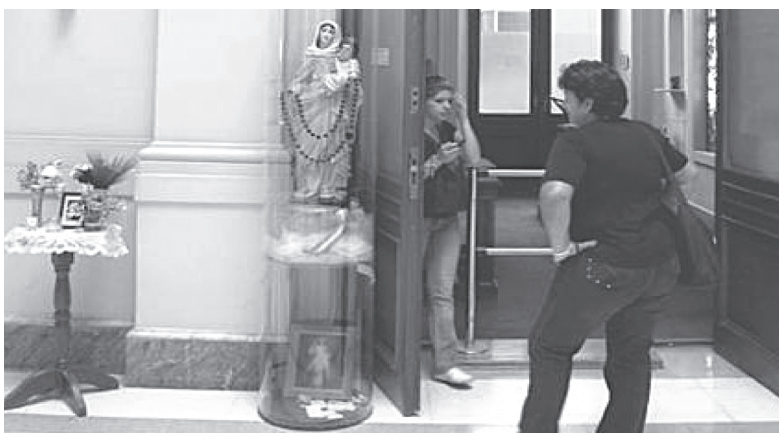
Virgem Maria na Casa Rosada (sede do Poder Executivo da Nação)