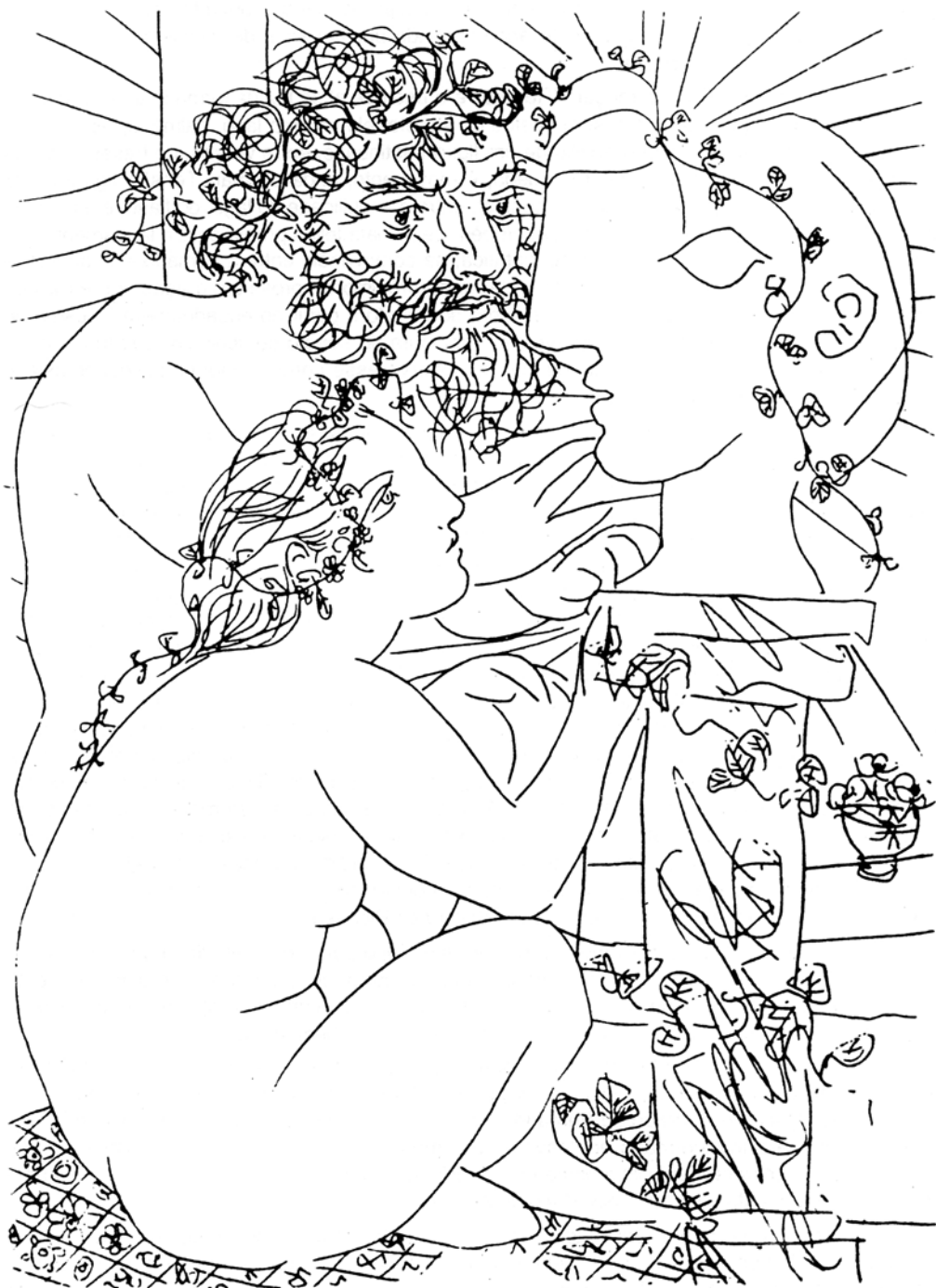
"Escultor e modelo sentados diante de uma cabeça esculpida", gravura do espanhol Pablo Picasso