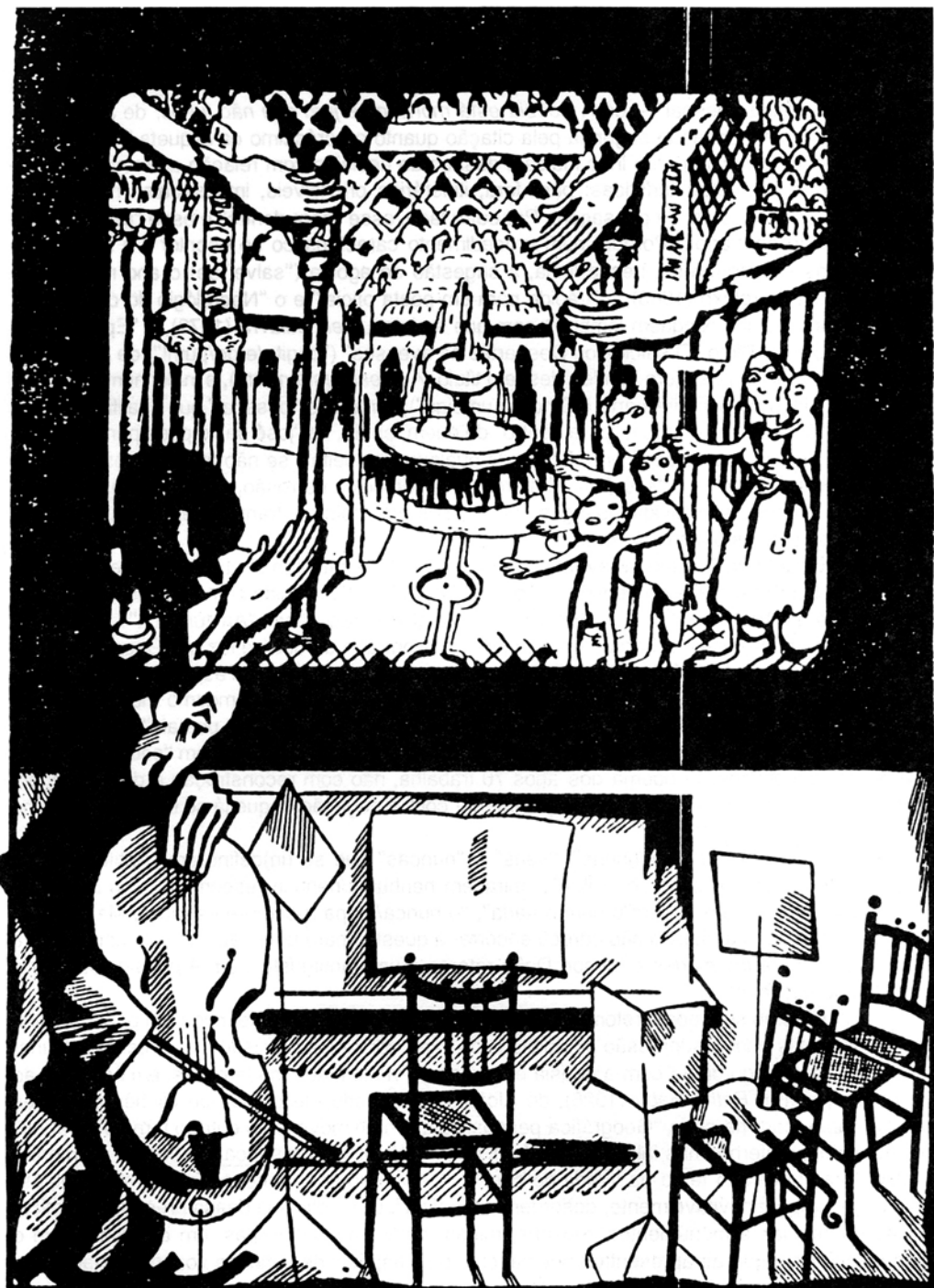
Ilustração de Paim para o livro "Pathé Baby", de Antônio de Alcântara Machado, intitulada "Granada"