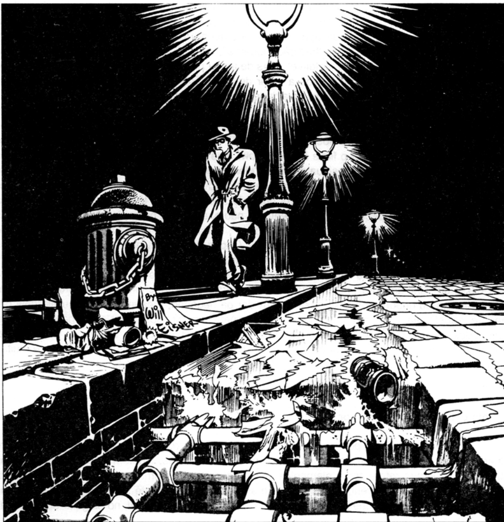
Banco de Dados

Não que Sebastião Uchoa Leite deixe de lado, neste livro, cobras, crimes e inscrições de w.c. como algumas das belas-artes. Pelo contrário. Passa a nuançá-los (como sugeria Tho-