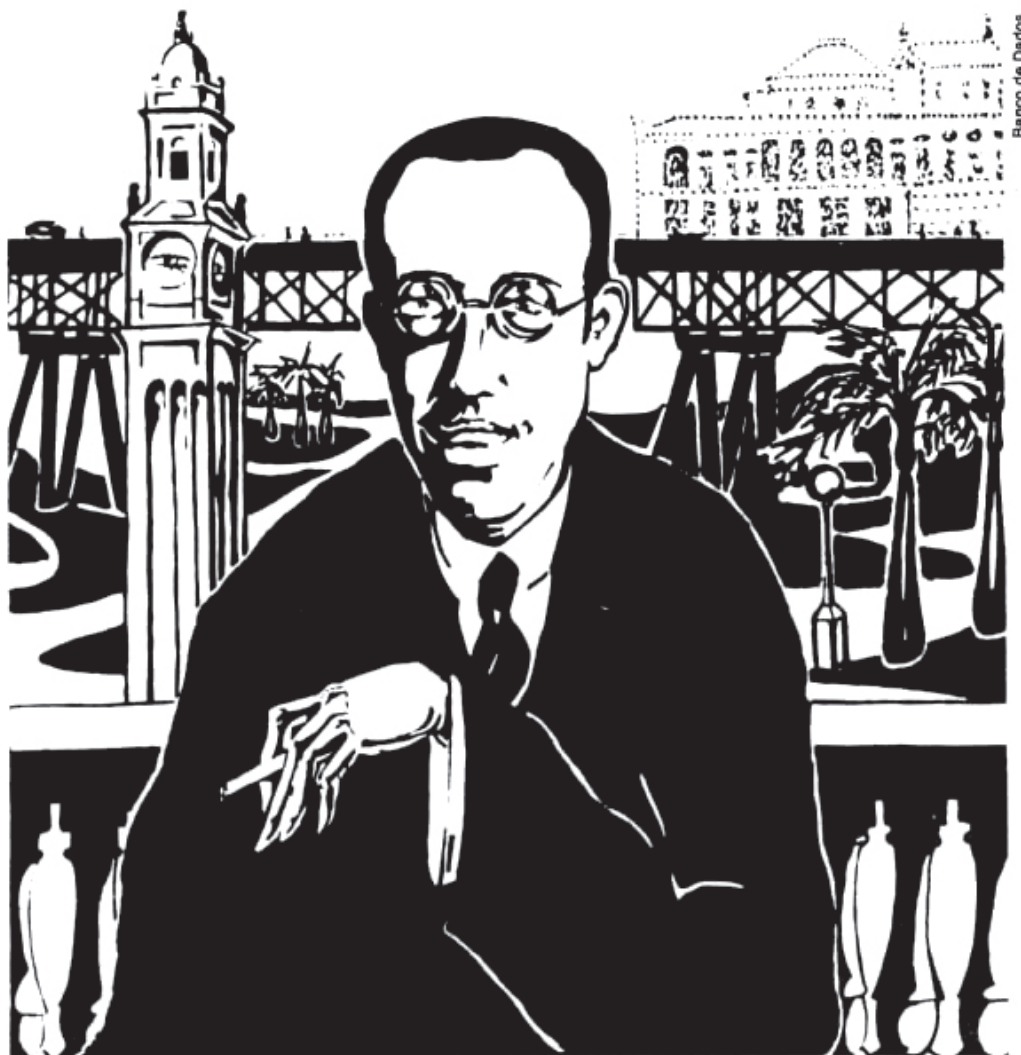
"Retrato de Mário de Andrade", de Zina Aita (1923); nanquim sobre papel

Trata-se portanto de uma meditação itinerante entrosada na era da mecanização, e tanto quanto sei é a primeira onde o deslocamento no espaço se faz por este meio. É claro que há poe-