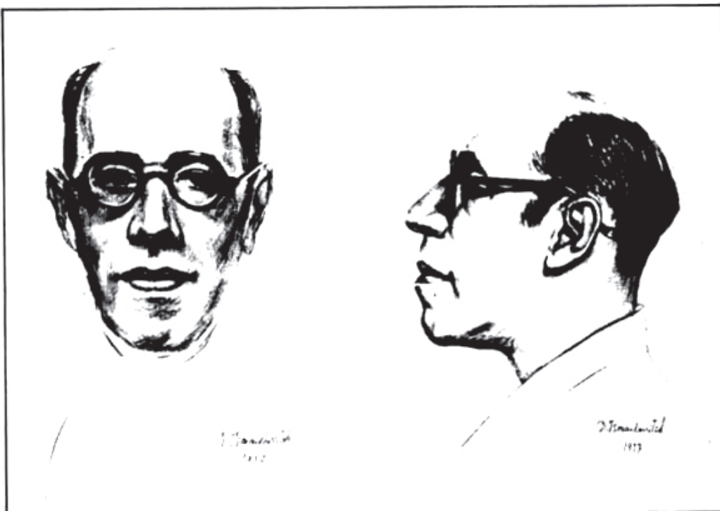
À esq., "Retrato de Mário de Andrade"; à dir., "Perfil de Mário de Andrade", de Dimitri Ismailovitch; ambos de 1937 e ambos carvão sobre papel