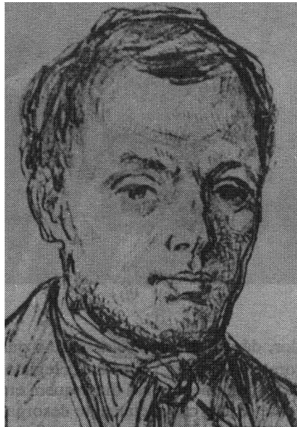
Acima, Franz Kafka; ao lado, Fiodor Dostoiévski

gado; a transformação do inocente em suspeito e do suspeito em delinqüente, aceita pelo próprio inocente, do fundo da sua desorganização mental, forjada pela inquirição.