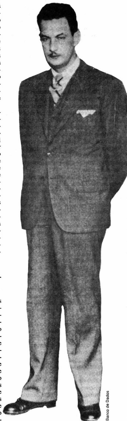
Banco de Dados

Durante toda a República no Brasil, as práticas repressivas dos aparelhos do Estado e das classes dominantes estiveram caracterizadas por um alto nível de ilegalidade, independentemente da vigência ou não das garantias constitucionais. Para os pobres, miseráveis e indigentes que sempre constituíram a maioria da população podemos falar de um ininterrupto regime de exceção paralelo, sobrevivendo às formas de regime, autoritário ou constitucional. Nesse regime político a ilegalidade a que estão submetidas as classes populares, as classes torturáveis, é muito mais larga do que aquela presente na aplicação da lei ou nas práticas policiais. Esse regime independe do regime político propriamente vigente, do regime constitucional: nenhuma das chama-