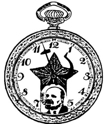
“Relógio do proletariado”

– O projeto da habitação resultava de um complexo estudo racional e científico, que visava dar a todos os moradores os mesmos direitos, “mas essa igualdade de direitos não define os próprios direitos. O que se pode e o que se deve dar a cada um em matéria de habitação, levando-se em conta as condições econômicas e financeiras do mo-