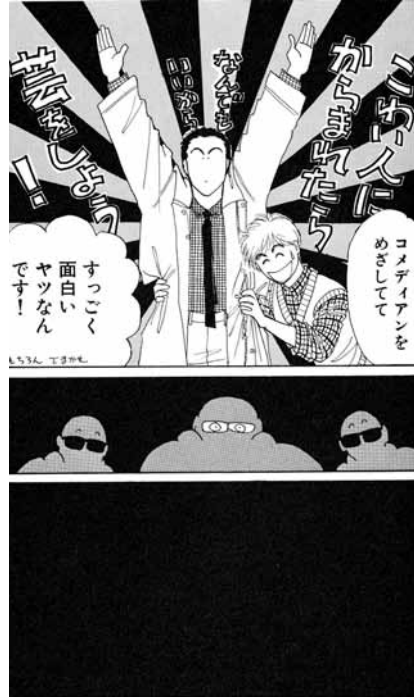
Eien no Nohara (O Campo Eterno), de autoria de Mieko Ousaka, p. 127

Ikeda 1 , publicado pela editora Shûei de 1975 a 1981, em 18 volumes, cuja história se passa na Alemanha e Rússia, na época da Revolução Russa.