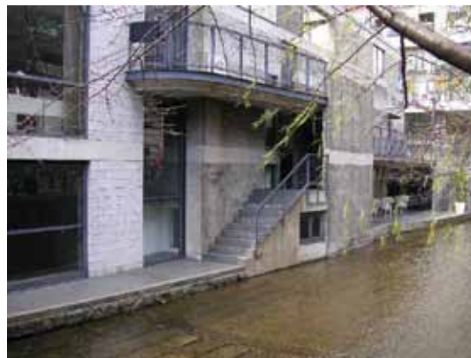
Times I , de Tadao Ando, em Kyoto, Japão.

Times I (1984) é um centro comercial em Kyoto, ao lado do Rio Takase, no qual o arquiteto procurou estabelecer uma integração entre a água e a edificação, criando uma espécie de engawa , ou seja, uma zona intervalar entre o interno e o externo. O nível da construção foi determinado a 10 cm