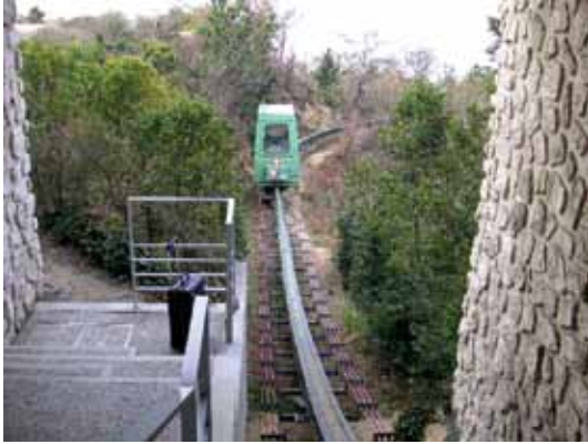
Monotrilho entre o Museu de Arte Contemporânea e o Hotel Anexo, de Tadao Ando, em Kyoto, Japão. Fotografia da autora

acima do nível da água e não se colocou nenhuma barreira entre o rio e o pavimento, permitindo-se, então, uma integração harmoniosa entre a arquitetura e o rio que, para muitos, preserva a memória coletiva do povo local.