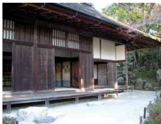
Engawa da casa de Shûgakuin Rikyû, em Kyoto, Japão.

O caso do sandô dos templos e santuários refere-se à espacialidade de passagem e de fronteira espaçotemporal entre os espaços profano e divino. Esse trajeto é percorrido para que o visitante possa,