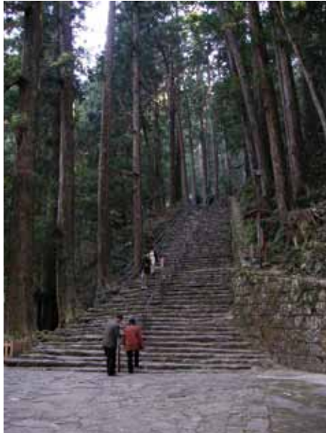
Escadarias: a de cima, em Kumano, Japão, e a de baixo, na Piazza Spagna, em Roma, Itália.