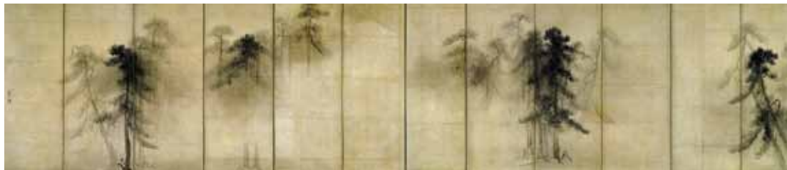
Shôrin-zu Byôbu (Biombo das Árvores de Pinheiro) , de Tôhaku Hasegawa

construída pelo espaço da neblina que envolve as árvores. Os pinheiros – que se apresentam em tonalidades diferentes para representar a profundidade – emolduram a paisagem formada pelo espaço vazio. Invertem-se, assim, a figura e o fundo nessa pintura de Hasegawa e revela-se a ambivalência, que é uma das características do Ma .