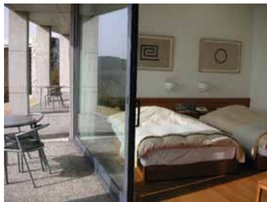
Apartamento do Hotel Anexo ao Museu de Arte Contemporânea, de Tadao Ando, em Kyoto, Japão.