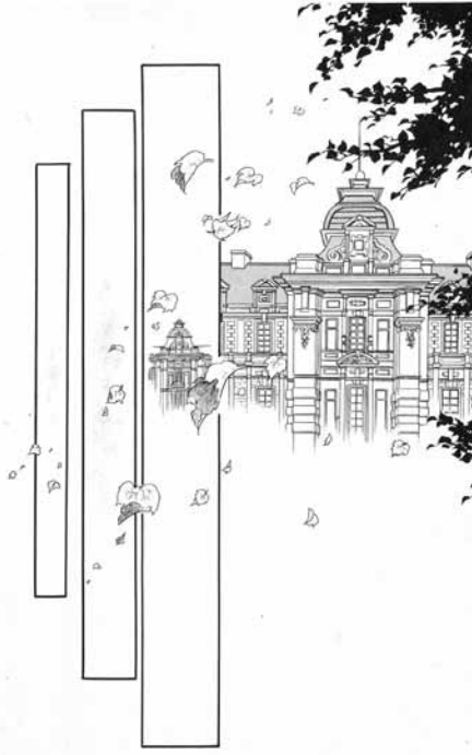
Orufesu no mado (Das Fenteeer Von Orpheus – Janela de Orfeus), de autoria de Riyoko Ikeda, p. 132