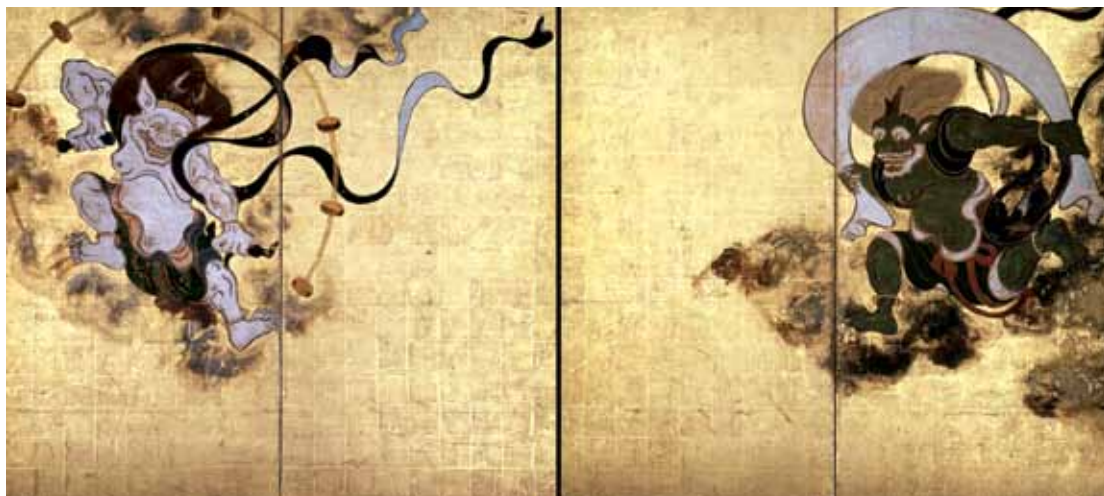
Fûshin Raishin-zu Byôbu (Biombo do Deus do Vento e Deus do Trovão) , de Sôtatsu Tawaraya

Pouco se sabe sobre o autor do Biombo do Deus do Vento e Deus do Trovão , Sôtatsu Tawaraya, mas a sua representatividade verifica-se na inovação proporcionada em relação à pintura aristocrática yamato-e da Era Heian (794-1185). Baseado em