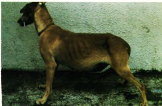
FIGURA 1 – Fêmea canina, sem raça definida, com aumento de volume abdominal bilateral.