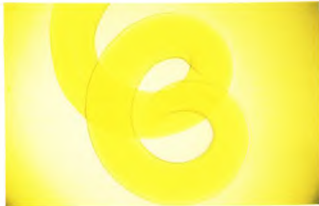
FIGURA 4 – Dirofilaria immitis - extremidade posterior espiralada. Aumento 40x