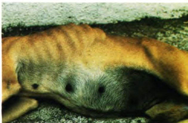
FIGURA 2 – Região abdominal distendida pela coleção líquida peritoneal (transudato modificado, pH= 8,0, densidade =1039, de côr amarelo-citrino.