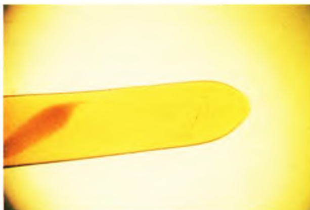
FIGURA 3 – Dirofilaria immitis - extremidade anterior romba, boca sem lábios. Aumento 40x