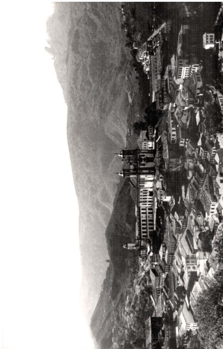
Figura 1 – Ouro Preto (Foto: do autor).