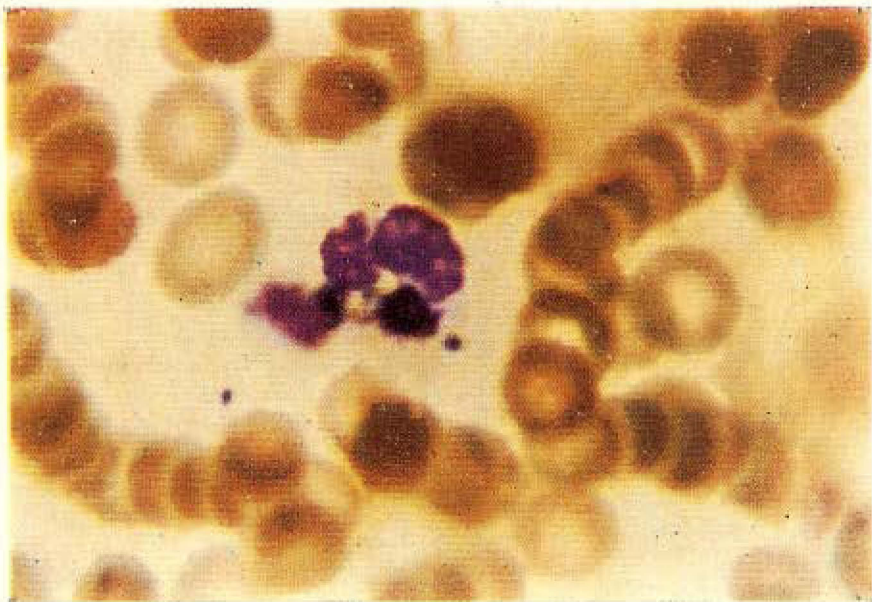
Fig. 1 — Aspecto de um neutrófilo com redução de NBT positiva.

três diferentes Autores, que não conheciam o diagnóstico no momento do exame. Para o resultado final foram utilizadas as médias aritméticas dos resultados obtidos.