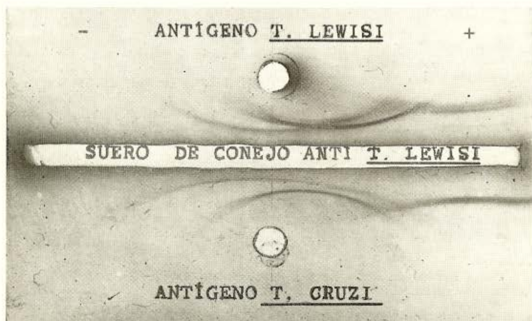
Fig. 2 — Inmunolectroforesis. Ambas precipitaciones muestran identidad cualitativa.

Otro aspecto, desde el punto de vista médico, es el de encontrar antígenos comunes entre especies avirulentas para el hombre, utilizandolas para protegerlo contra especies