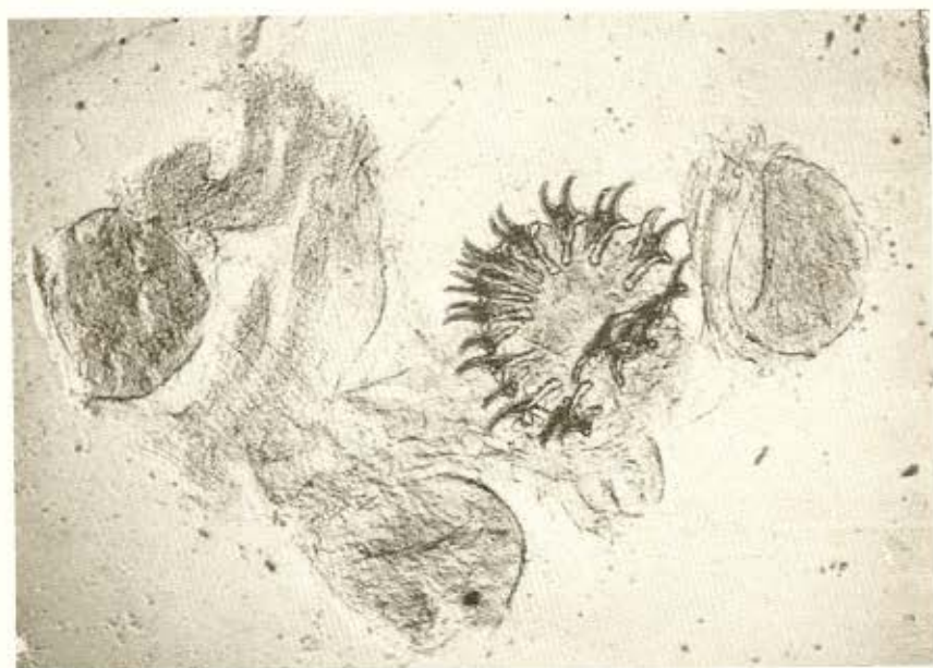
Fig. 4 — Escólice parcialmente degenerado, mostrando ainda a coroa de acúleos.