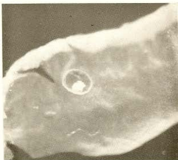
Fig. 3 — Uma das vilosidades mostrando, no seu interior, uma formação densa que corresponde ao escólice.