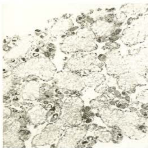
Fig. 5 — Glândula digestiva de A. glabratus , apresentando numerosos esporocistos secundários, com cercárias formadas, 48 dias após a penetração dos miracídios (100×).

Vinte A. glabratus , infectados nas mesmas condições, dos quais 13 sobreviveram, apresentaram em 100% dos casos esporocistos secundários e cercárias formadas naqueles órgãos (Fig. 5), ao lado de dezenas de esporocistos primários íntegros na região céfalo-podal.