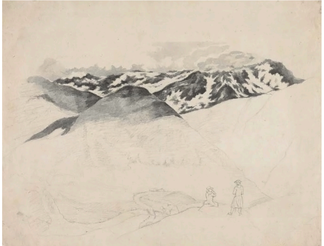
Figura 3: Franja de la vista hacia Italia desde San Gortardo. Grafito y aguada gris; sobre papel blanco-amarillo (Goethe, 22 de junio de 1775).

39 Es importante asimismo considerar esta argumentación de Agamben bajo el auspicio de su comprensión de lo contemporáneo y más allá, de la contemporaneidad. Para ello ver (Agamben 2009).