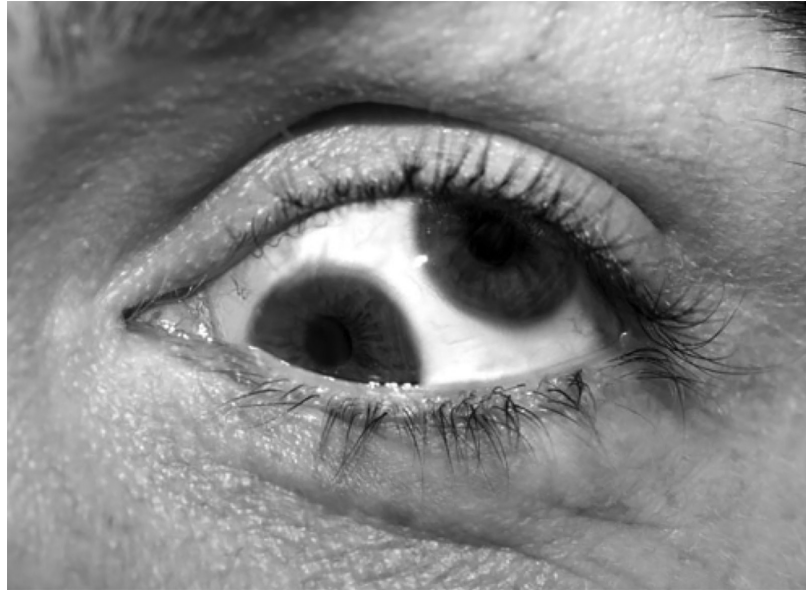
Figura 1: Double Eye. Olafur Eliasson's Eye(s). Berlin, Summer 2004.