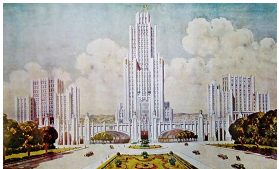
Figura 1: Palácio da Justiça de São Paulo. Foto Postal Colombo 1967. Fonte: < https://sampahistorica.wordpress.com/2014/05/09/tj/ >. Acessado em março/2018.