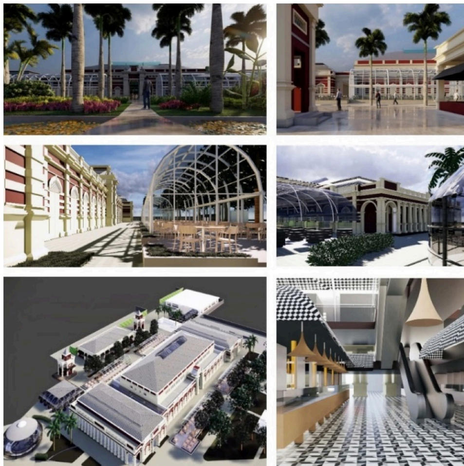
Figura 5: Mosaico, com imagens da maquete eletrônica 3D e renders do NMSB.

O projeto divulgado conta com um incremento de 2.065 m 2 de área bruta locável à área já existente no complexo, com sugestões de operações de varejo, de serviços e de espaços complementares como: centro de convenções e de eventos; restaurantes terraços; restaurantes panorâmicos; empório; cervejaria; boulangerie (padaria gourmet ); pub ; Ver-o-pesinho (boieiras); escola de gastronomia (UEPA); espaços artesões paraenses (barro, miriti, cestaria etc.); coliseu de eventos populares (danças, teatro fantoches, boi-bumbá, carimbó, entre outros); e “calçadão dos permissionários” (BELÉM, 2019a). O recorte discursivo 02 foi retirado do memorial justificativo do projeto e fundamenta algumas escolhas: