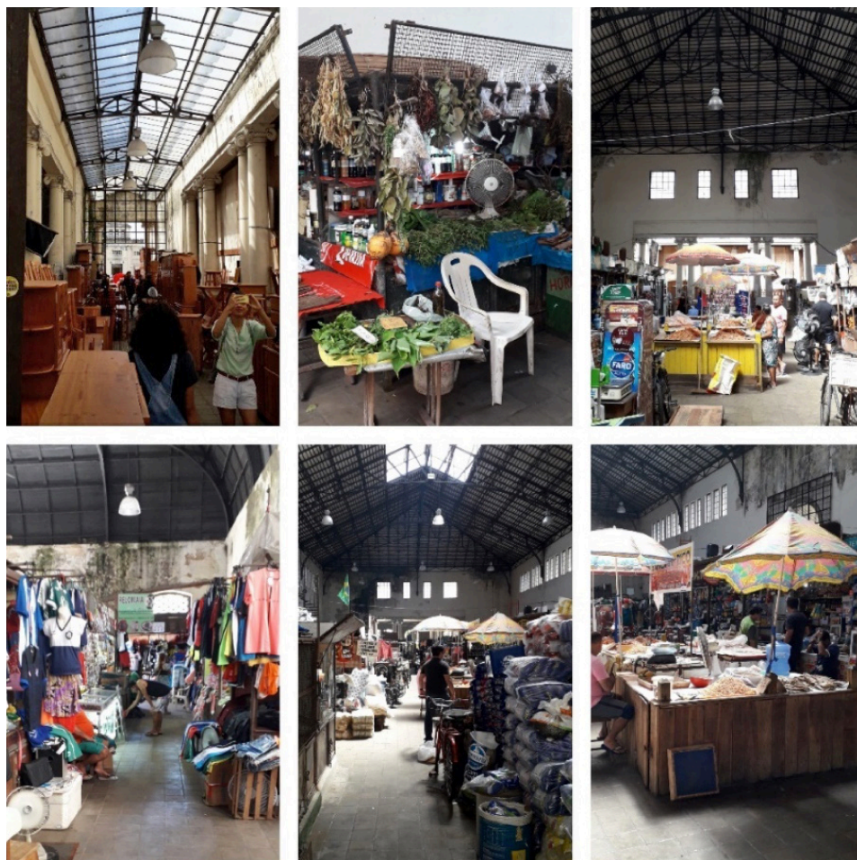
Figura 2: Mosaico com fotos internas do mercado.

Pelas imagens, pode-se depreender que a situação atual do mercado é, no mínimo, preocupante. O prédio está em avançado estado de degradação, com sérios problemas estruturais, com fiações expostas, infiltrações e esquadrias quebradas, o que afeta as atividades comerciais ali desempenhadas. Todas as suas fachadas se encontram cobertas de pichações (Figura 3) e, mesmo a Praça Floriano Peixoto, popular ponto de atividades sociais e artísticas, além de eventos culturais e políticos atrelados aos movimentos sociais urbanos (Figura 4) de grande importância na vida cotidiana da cidade de Belém, conta com monumentos sem qualquer salvaguarda, os quais já foram, inclusive, parcialmente furtados e depredados. São notórias as más condições de higiene e de limpeza no seu interior e, principalmente, no seu exterior, em que há acúmulo de lixo a partir de descartes inadequados.