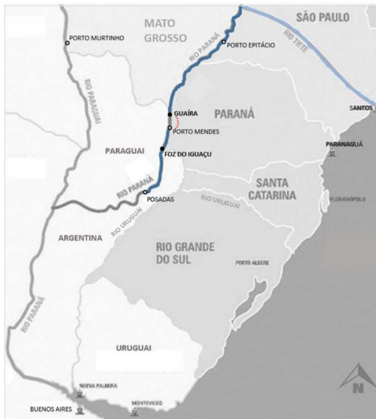
Figura 1: Mapa esquemático da Região Sul do Brasil destacando os rios Paraná e Tietê.

De maneira preliminar, desde o início da década de 1950 a CIBPU já dedicava esforços para um plano de aproveitamento hidroelétrico do rio Paraná e seus afluentes, integrado a um programa de navegabilidade (Lima, 2004; Chiquito, 2010). No Departamento de Estudos e Projetos (DEP) da CIBPU, foram feitos vários estudos técnicos sobre as possíveis localizações de uma ou de várias hidroelétricas no Rio Paraná, aproveitando-se do potencial das Sete Quedas em Guaíra e a navegação interior dos rios Tietê e Paraná (Chiquito, 2010). Contudo, foi verificado que o potencial energético aumentava conforme se distanciava do Alto Paraná (Guaíra) para o Baixo Paraná (Foz do Iguaçu), atingindo as águas compartilhadas com os países vizinhos (Lima, 2004).