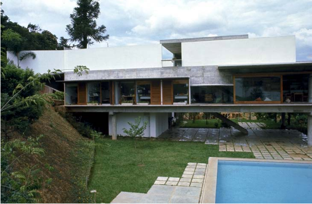
Figura 1: Residência Guedes – foto vista lateral.