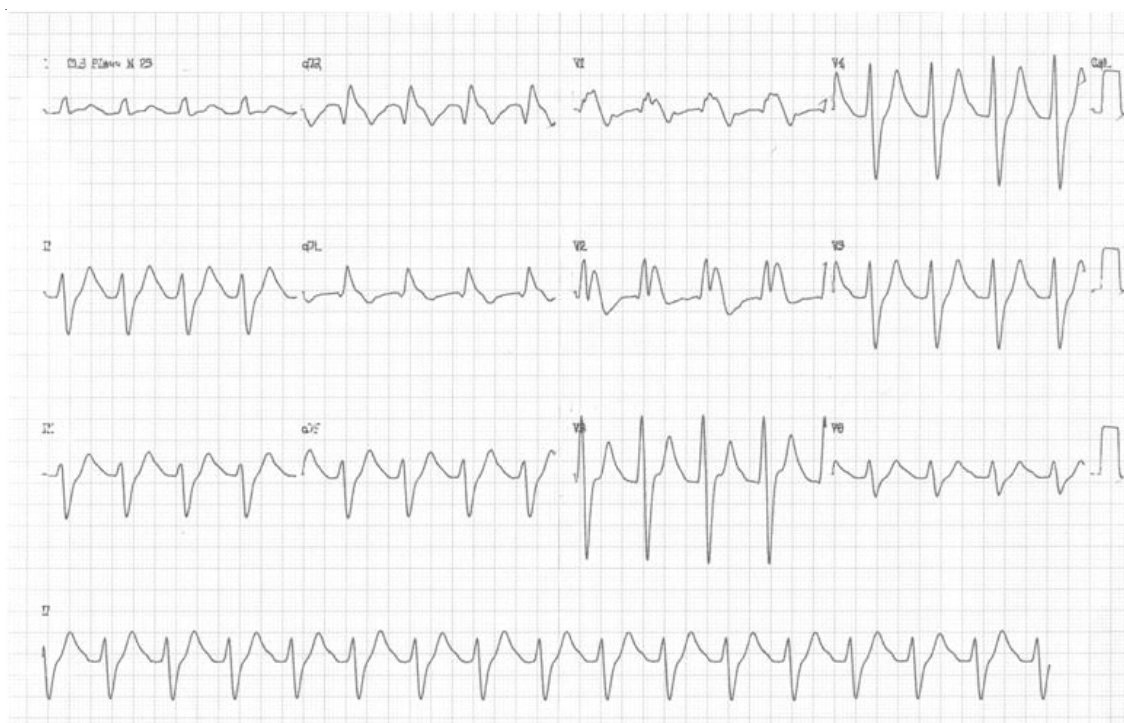
Figura 2: ECG de paciente intoxicado por ADT mostrando: taquicardia sinusal (100 bpm), importante alargamento do complexo QRS (220 ms), proeminente onda R em aVR, padrão Brugada-like (bloqueio de ramo direito associado à supradesnívelamento do segmento ST em V1-V3). Este paciente apresentou crises convulsivas durante evolução. Reproduzido conforme autorização obtida por termo de consentimento do projeto CEP/HCFMRP-USP 11738/2004.

lizando-se de fórmulas como a de Bazett ( QT_c = QT medido dividido pela raiz quadrada do intervalo R-R precedente, em segundos). 24