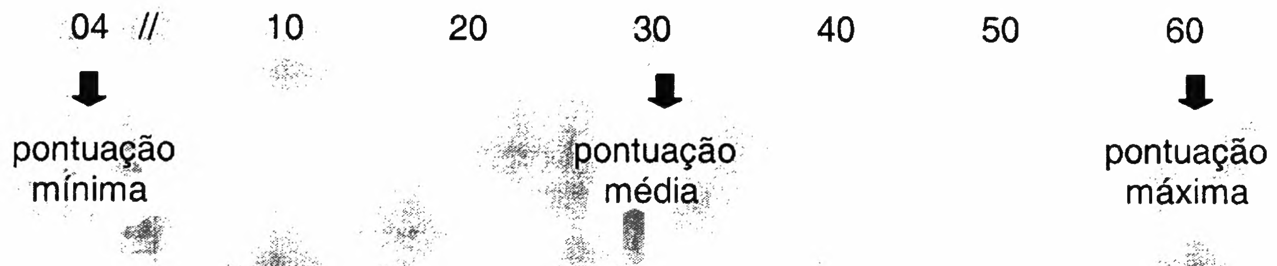
FIGURA 1 - Referencia a dispersão sob a qual os grupos poderiam se distribuir em termos de escores obtidos no teste de metacognição (Conhecimento metacognitivo).

No que concerne a comparação entre mono-hemisféricos (hemisféricos direito e hemisféricos esquerdo) e bi-hemisféricos, verificou-se que estes últimos (bi-hemisféricos) foram significativamente superiores aos dois outros grupos, fato identificado através da Análise de Variância não paramétrica (Kruskal Wallis Test) com significância associada ao \chi^2 13,303, 2 graus de liberdade, sendo p < 0,05 . Um sumário desta análise está apresentado na TABELA 1.