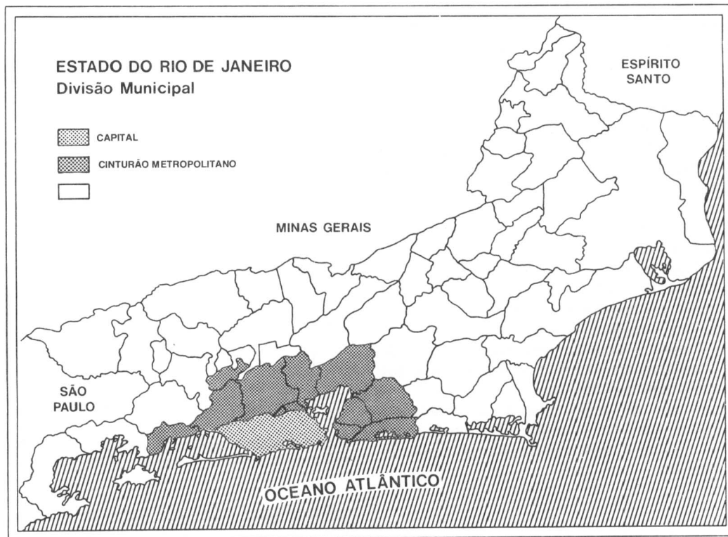
Figura 1. Mapa do Estado do Rio de Janeiro, segundo regiões.