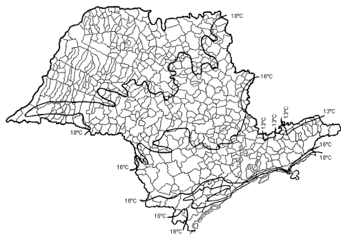
Figura 1 - Isotermas de julho. Estado de São Paulo (elaborado com dados até 1974).