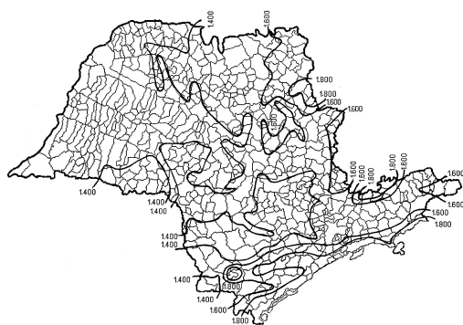
Figura 2 - Isoietas anuais. Estado de São Paulo, 1974 a 1988.