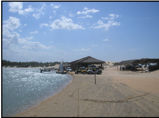
Figura 2 - Lagoa da Torta – Tatajuba