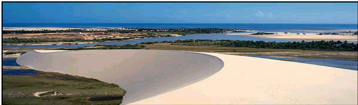
Figura 1- Vista da barcana em Tatajuba, denominada de duna “encantada”

Na década de 1978, os moradores de Tatajuba tiveram que se deslocar em virtude do movimento das dunas que migravam em direção às casas, do lado leste para oeste, soterrando-as, até mesmo a Igreja, cujo padroeiro é São Francisco foi soterrada. A gamboa 4 que existe no lugar teve seu curso deslocado e, resultou na divisão da vila 5 em quatro núcleos: o de Tatajuba (também chamada de Nova Tatajuba e núcleo central), Vila São Francisco, Vila Nova e Vila da Baixa da Tatajuba, favorecendo a passagem das dunas, livrando as casas de futuros soterramentos. Na figura 1, a seguir, pode-se observar a duna barcana, que através de sua migração, foi responsável pelo soterramento da antiga vila de Tatajuba. As dunas barcanas são consideradas pela comunidade como encantadas. Muitas lendas são originadas da existência dessa duna e fazem parte do imaginário popular.