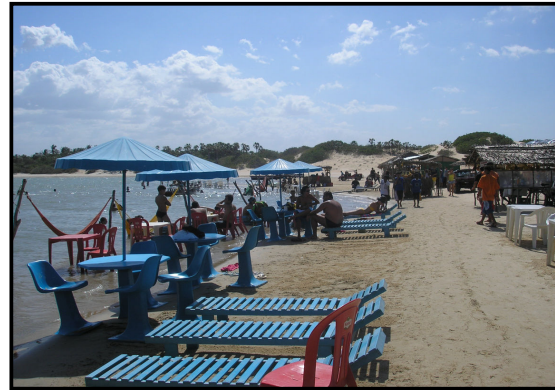
Figura 3 - Equipamentos de lazer na lagoa da Torta