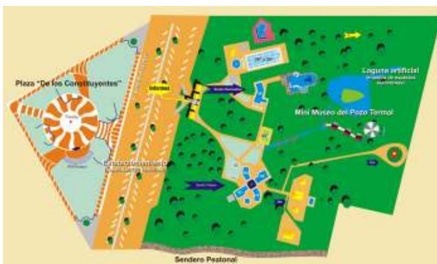
Gráfico 1 - Plano del parque termal y zona de influencia