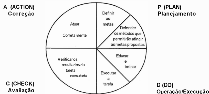
FIGURA 1 – CICLO PDCA DE CONTROLE DE PROCESSO

O Ciclo PDCA de Controle de Processo é utilizado para manter e melhorar os níveis de controle dos sistemas da qualidade (Figura 1).