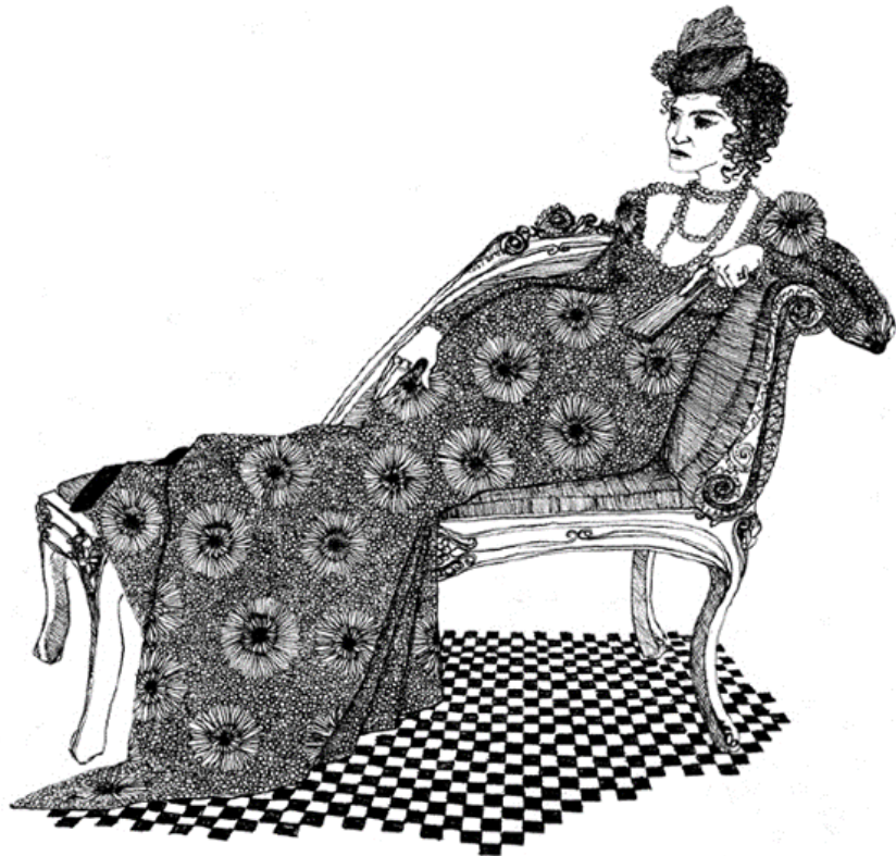
Fig. 1. Anna Kariênina, ilustração de Agnieszka Wrzosek para K Mag magazine, março de 2013. ( https://cargocollective.com/agiewu/Anna-Karenina )