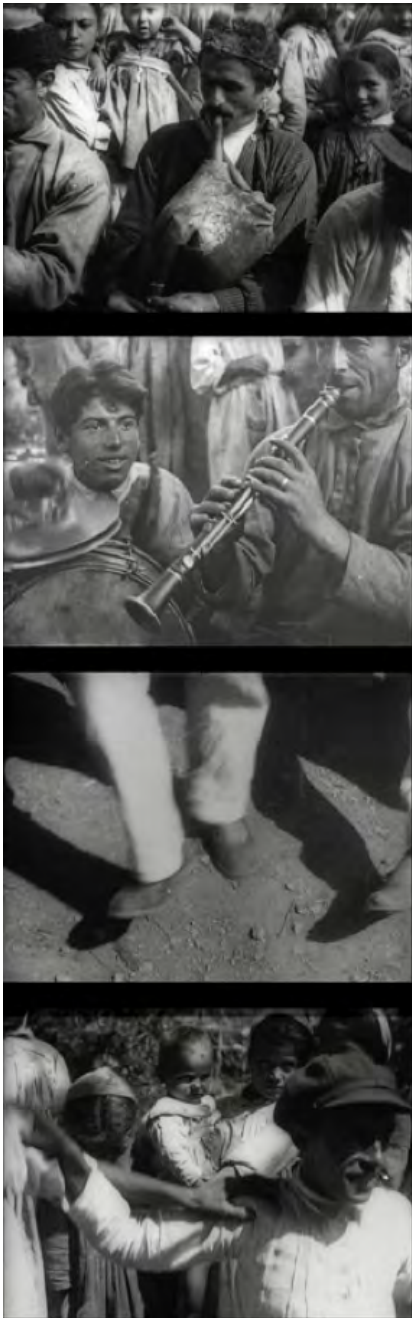
Figura 3: Música e danças na Crimeia em A sexta parte do mundo (1926)