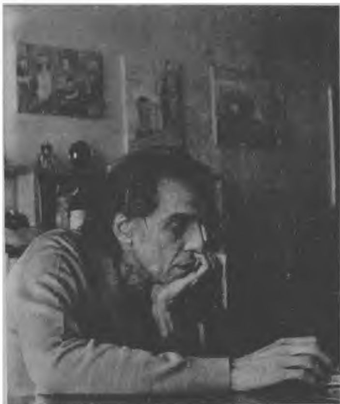
Ferreira Gullar no Exílio (1976): "O problema reside em saber se nos países subdesenvolvidos, existe um ângulo peculiar donde se vê a História".

No plano propriamente intelectual, vinha para a linha de frente a preocupação com o problema da identidade nacional .