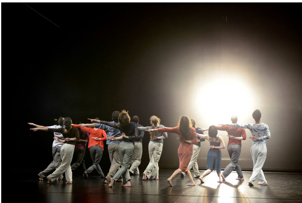
Figura 2 – Elenco.

Com esse “despir”, todo o elenco entra em uma grande dança muito agitada e com uma movimentação bastante pessoal. Percebe-se que foram trabalhadas unidades de movimento e que cada intérprete incluiu suas próprias habilidades e estilos de movimentação.