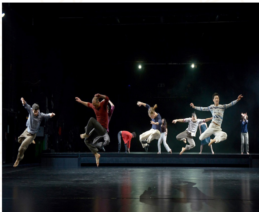
Figura 4 – Elenco.

A próxima cena é um divisor de águas, que se utiliza de um efeito cênico para mover a audiência da situação cômoda de observadora, relativamente estática, na qual, através de uma luz muito forte direcionada para a plateia, o jogo cênico é interrompido. O efeito poderia ser comparado a um grito, uma sacudida, uma anunciação acompanhada de uma música com sons mais duros e agressivos. A cena se constrói formando, no palco, dois níveis. As mulheres dançam no nível superior com cabelos soltos e movimentando muito o tronco e os braços. A utilização da parte superior do corpo como ponto de partida do movimento é uma característica bastante comum nas movimentações encontradas na dança teatral. Já as ações dos rapazes acontecem, na sua maioria, no plano baixo, pelo chão, finalizadas com saltos e com ações muito acrobáticas.