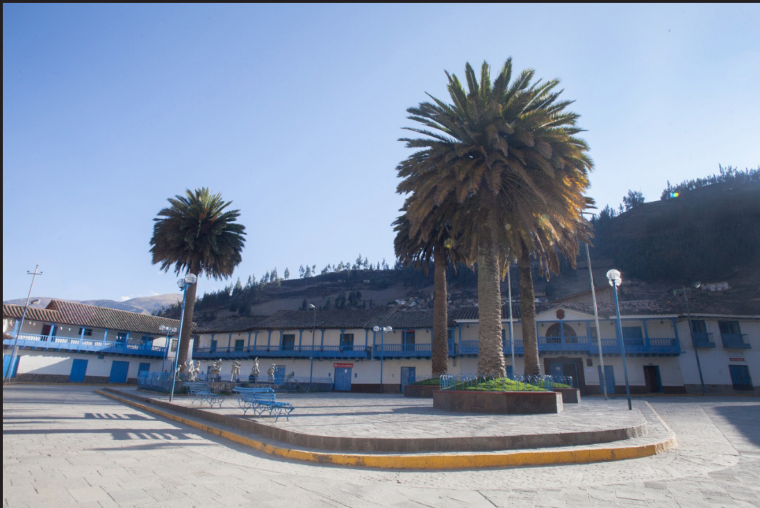
Praça principal do povoado.