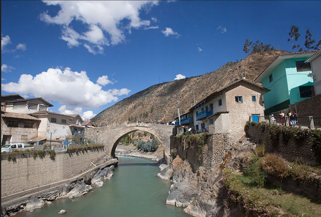
Ponte Carlos III , por onde se pode entrar no povoado.