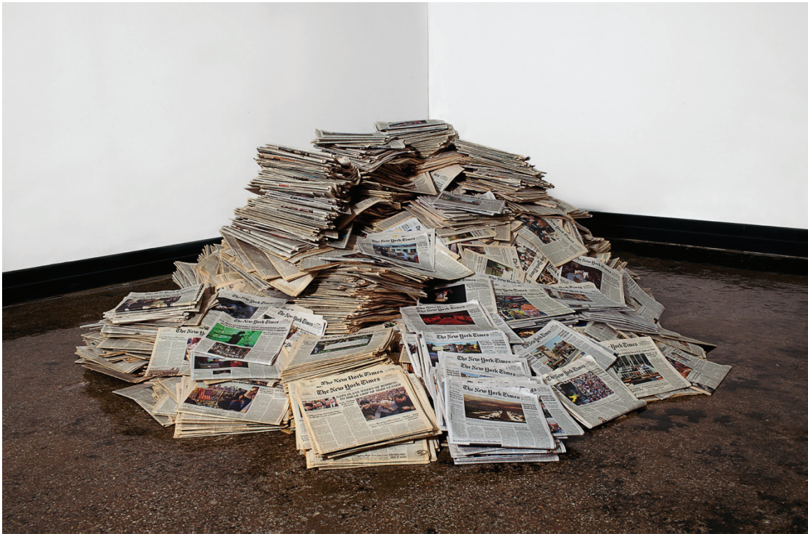
New York Times, April 1, 1999 – September 7, 2011