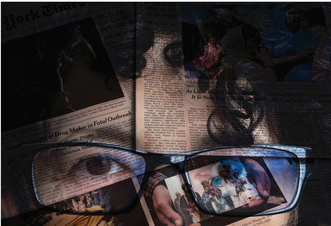
Fore Eyes, 2012