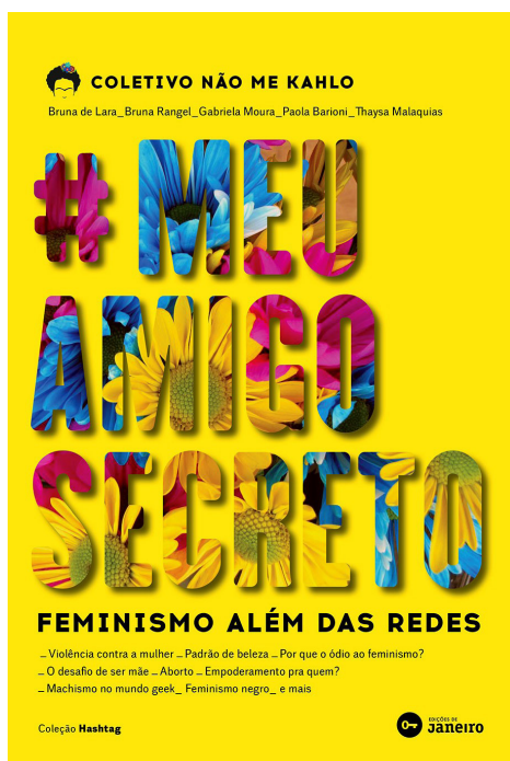
Figura 1. Capa do livro #MeuAmigoSecreto , produzido pelo coletivo Não Me Kahlo.

O uso da internet, apesar dos seus limites e das repressões, possibilita uma forma mais democrática de retratar e divulgar as ideias feministas, viabilizando uma produção estética bastante ampla e inúmeros debates sobre as ideias difundidas, já que para cada postagem abre-se a possibilidade de comentários para o público receptor. (Ferreira, 2013, p. 38)