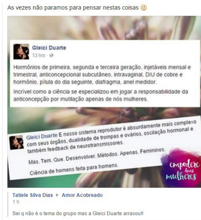
Figura 4. Postagem realizada por usuária do grupo Mujeres en Círculo.

Da mesma maneira, temos notado que no grupo existe uma linha constante de discussão sobre temáticas referidas ao corpo da mulher como objeto de desejo e manipulação: a vergonha estética a que muitas mulheres são expostas no seu dia a dia pelo seu físico; a maternidade como um destino, e não tanto quanto uma escolha pessoal; e o machismo dominante no desenvolvimento de métodos anticoncepcionais que sometem o corpo da mulher a procedimentos altamente invasivos e colocam nela a responsabilidade da proteção sexual, como vemos na seguinte postagem: