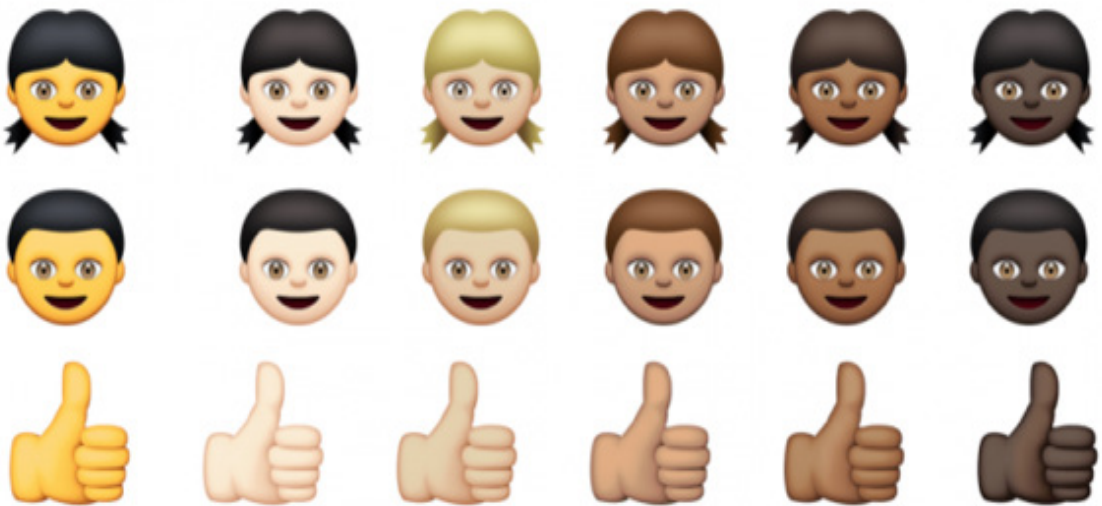
Figura 1. Emojis com diferentes tons de pele.

A cultura digital parece estar sempre em movimento, num processo contínuo, o que mostra o desejo pelo consumo de novidades diárias, ou a adaptação às demandas dos usuários. Nesse sentido, são frequentes as revisões de emojis e criação de outros para conceitos que ainda não são representados. Um exemplo disso são as cores diferentes dos rostos e mãos (Figura 2) a fim de englobar a diversidade racial.