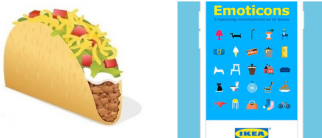
Figura 6. Emojis icônicos: Taco Bell (6A) e Ikea (6B).

As duas imagens a seguir apresentam bons exemplos desse tipo de apropriação, cujo fundamento é a semelhança entre os próprios emojis e os produtos oferecidos. Na Figura 6A, temos uma representação bastante literal do taco produzido pela marca Taco Bell. Em 6B, há o conjunto de emojis desenvolvido pela marca Ikea, representando não apenas seus produtos, mas também elementos do seu universo semântico (casa, cartão de fidelidade, ferramentas etc.). Em ambos os casos, ainda que se notem diferentes níveis de estilização, o que predomina é o caminho da literalidade.