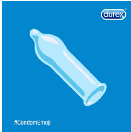
Figura 4. Emoji de preservativo – Durex.

Em outros casos, o diálogo entre marcas e emojis pode ocorrer de forma conflituosa, quando os significados desejados pela empresa divergem da convenção estabelecida na linguagem dos emojis. Recentemente, a Hershey, empresa americana de chocolates, criou um símbolo para sua identidade corporativa baseado no chocolate Kisses (Figura 5). Esse produto tem a forma de gota com uma fita na parte superior para facilitar a abertura da embalagem. Entretanto, a empresa teve que lidar com a semelhança do símbolo proposto com o emoji estabelecido e convencionado que representa algo muito diferente do que o símbolo da empresa desejava significar.