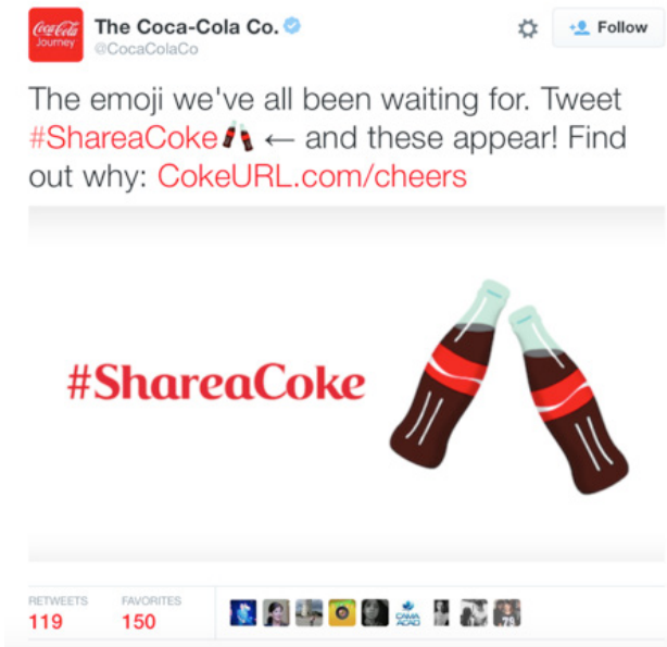
Figura 2. Emoji customizado – campanha “Share a Coke”.

Outro exemplo que obteve grande repercussão foi a criação de um emoji pela Domino’s, rede de pizzarias dos Estados Unidos, também em 2015 (Figura 3). Nesse caso, o elemento tinha uma função específica, relacionada ao consumo do produto oferecido pela marca: tornar o processo de compra das pizzas mais rápido e instantâneo.