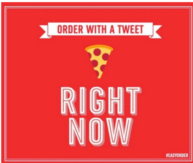
Figura 3. Emoji customizado – Pizzaria Domino’s.

Outro exemplo que obteve grande repercussão foi a criação de um emoji pela Domino’s, rede de pizzarias dos Estados Unidos, também em 2015 (Figura 3). Nesse caso, o elemento tinha uma função específica, relacionada ao consumo do produto oferecido pela marca: tornar o processo de compra das pizzas mais rápido e instantâneo.