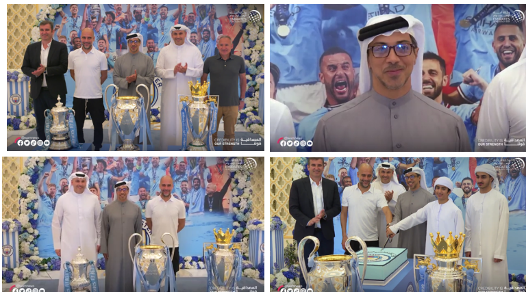
Figura 1. Reproduções de trechos do vídeo de divulgação da visita da comitiva do Manchester City a Abu Dhabi.

É evidente que temos diversas camadas de sentido, algumas explícitas, outras latentes, nessa curta sequência de imagens. Uma das conclusões possíveis é que se trata de uma peça de propaganda (ou de diplomacia pública) engendrada por um Estado nacional para divulgação perante diversos públicos de interesse (domésticos e internacionais, interessados ou não em esporte). O próprio xeque Mansour publicou trechos desse vídeo em um reels postado em seu perfil oficial no Instagram, para uma audiência estimada em 2 milhões e 400 mil seguidores (dados de maio de 2024). A publicação recebeu 35,1 mil curtidas e 967 comentários 8 , números bem acima da média de engajamento do perfil 9 , porém baixos se pensarmos em toda pompa e simbolismo em torno da cerimônia.