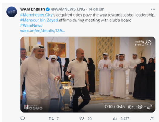
Figura 2. Reprodução de trecho do vídeo da agência oficial de notícias dos EAU.

Guiado por essa percepção, busquei rastrear onde o vídeo havia sido publicado originalmente. Com isso, cheguei a Emirates News Agency (WAM), agência de notícias oficial dos EAU, em sua conta oficial no Twitter (Figura 2). O perfil conta com 55,9 mil seguidores, mas, até 31 de julho de 2023, o vídeo, publicado às 2h50 da tarde do dia 14 de junho do mesmo ano, havia sido reproduzido apenas 2.477 vezes.