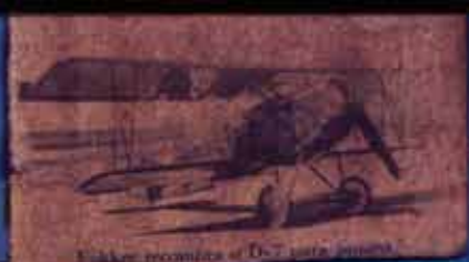
1. A later model of the D-7 with engine.