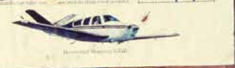
2. A later model of the D-7 with engine.