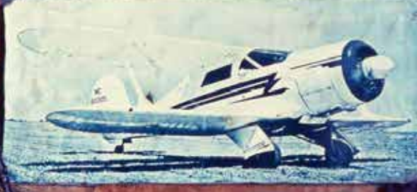
3. A later model of the D-7 with engine.