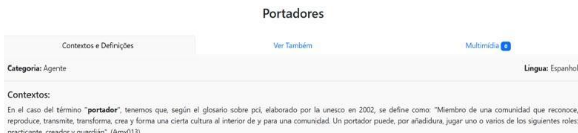
Figura 4 - Aba de contextos e definições do termo Portadores - espanhol