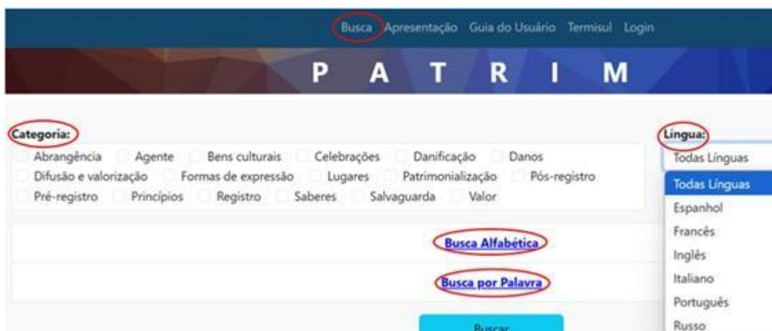
Figura 2 - Interface do usuário - base Patrim